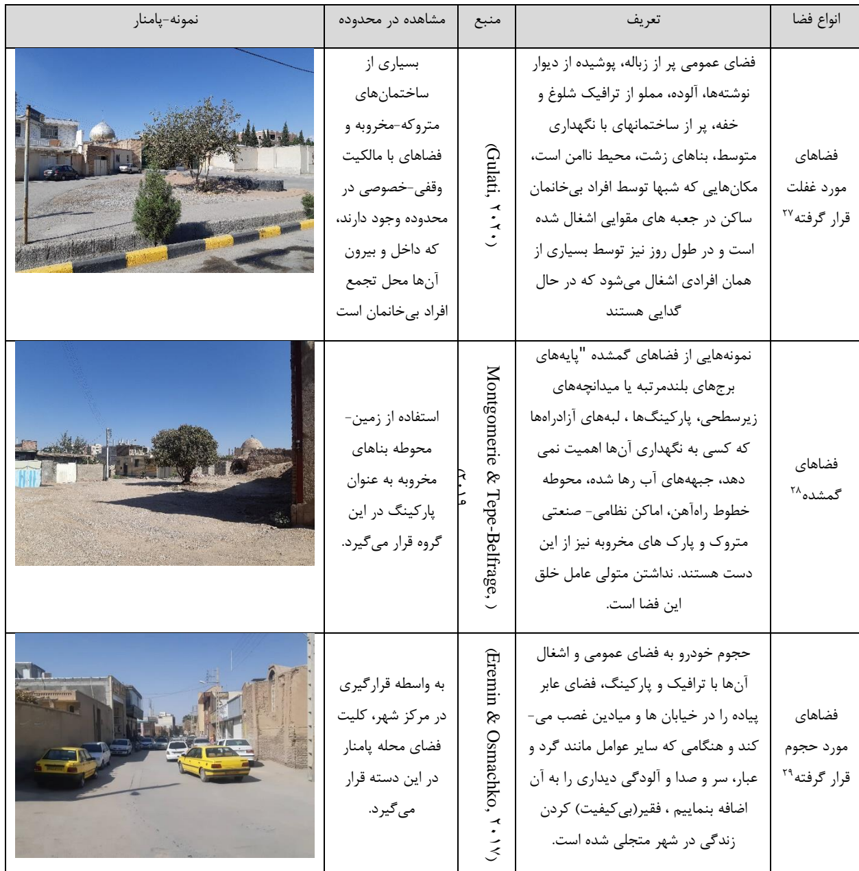
جدول ۲: انواع فضاهای شهری مسئله دار