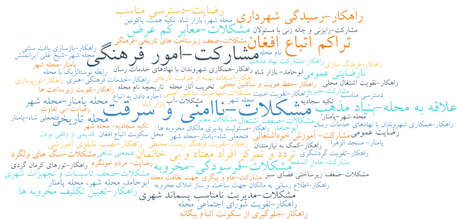
شکل ۳: ابر واژگان، مقوله‌های شناسایی شده در مصاحبه شهروندی (منبع: نگارندگان)

در ادامه ابر کدها (مقوله‌های) شناسایی شده ارائه شده است. بزرگی مقوله‌ها نشان‌دهنده تکرار بیشتر و در نتیجه اهمیت بیشتر آن‌ها از نظر شهروندان بوده است.