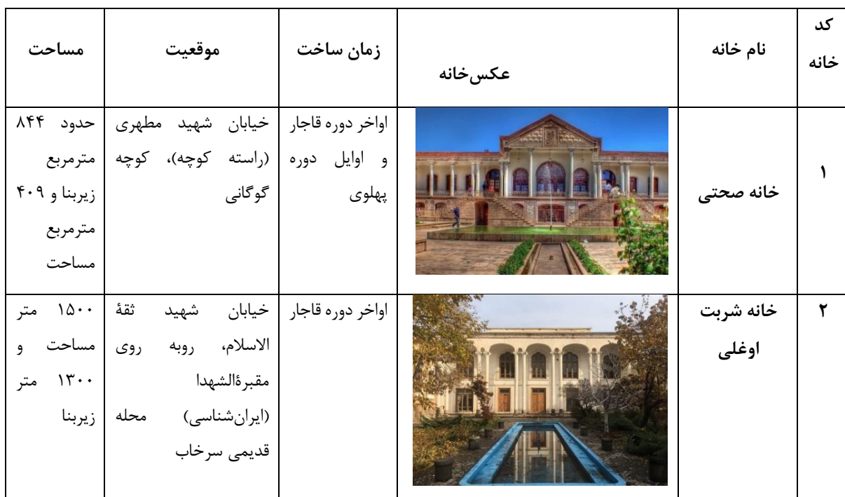
جدول ۱: مشخصات خانه‌های مورد مطالعه (مأخذ: نگارنده).

راهبرد اصلی این تحقیق، تحلیلی- تاریخی است، چون روند اصلی آن مبتنی بر جست‌وجوی پدیده‌های اجتماعی کالبدی در زمینه‌ای خاص و با جهت‌گیری تبیینی و روایی کل‌نگر است که مربوط به موضوعی در زمان گذشته است (گروت و وانگ، ۱۳۸۴). روش گردآوری اطلاعات ترکیبی از روش اسنادی، مشاهده و پیمایشی بود. بدین‌منظور، پرسش‌نامه‌ای برای سنجش میزان تاثیر و تجلی سنت یا مدرنیته در پنج مؤلفه خانه‌های تاریخی تبریز شامل روابط فضایی، تزئینات داخلی، نمای اصلی، روش ساخت و مصالح به‌صورت طیف پنج‌مرحله‌ای لیکرت (کاملاً سنت‌گرا، نسبتاً سنت‌گرا، میانه، نسبتاً مدرن، کاملاً مدرن) تنظیم شده و در اختیار ۳۵ نفر از متخصصان معماری که شناخت کافی از ماهیت معماری خانه‌های این دوره داشتند قرار داده شد. نهایتاً تعداد ۳۰ پرسش‌نامه تکمیل و جمع‌آوری گردید. یافته‌های پژوهش بر مبنای نتایج این پرسش‌نامه‌ها تدوین شده است. بازه زمانی مدنظر برای پژوهش از اواخر دوره قاجار تا اوایل دوره پهلوی اول است که تعداد ۱۶ خانه مرمت‌شده و حفاظت‌شده مربوط به این دوره که قابل‌بازدید هستند مورد بررسی قرار گرفته است. خلاصه‌ای از اطلاعات مربوط به خانه‌های منتخب در جدول شماره ۱ آمده است.