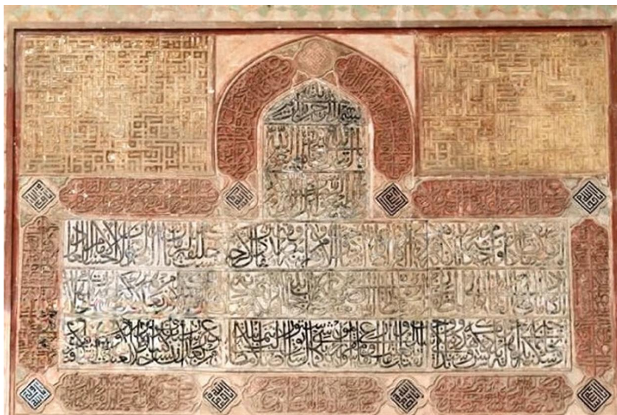
تصویر ۳. کتیبه از خوشنویسی در مسجد جامع اصفهان

خطوط اسلامی در ساختار از عناصر عمودی، افقی و دوایر، مرتبط باهم تشکیل شده‌اند که هر کدام از این عناصر دارای بیان نمادین هستند بخش قابل توجهی از حروف الفبای عربی در هنگام نوشتن، قوسی از دایره و منحنی را تشکیل می‌دهند، مانند خط ثلث و این قوس‌ها در خوشنویسی خطوط ایرانی تعلیق، نستعلیق و شکسته بیشتر می‌شوند. «دایره نماد آسمان، بی‌کرانگی، کمال و تمامیت است و نماینده کیفیت به حساب می‌آید» (بلخاری، پیشین: ۵۵۸).