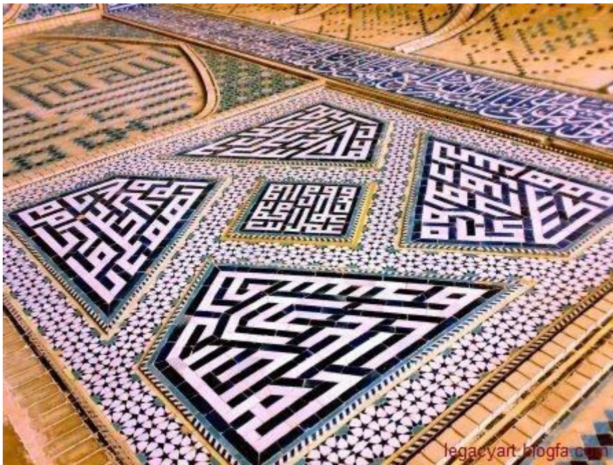
تصویر ۱. کتیبه‌ای از خوشنویسی در مسجد جامع اصفهان

«نیست در من جنبشی از ذات من اوست در من دم‌بدم جنبش فکن» (بلخی، ۱۳۶۰: ۶۵). به همین دلیل، هنر اسلامی جوهر منطقی و عقلانی‌اش همواره غیرشخصی و کیفی است (بورکهارت، پیشین: ۱۳۳). تصویر شماره ۱ نمونه از تجلی صفات الهی در کتیبه‌های مسجد جامع اصفهان است.