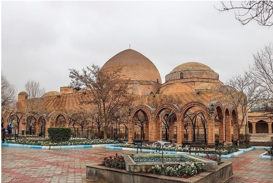
تصویر ۱. مسجد کبود تبریز

این ویژگی محدود به فضای و سازه بیرونی مسجد نیست، بلکه بررسی تزئینات درونی مسجد، کاربست آیات قرآنی، کاربرد رنگ آبی و فیروزه‌ای به‌نوعی تکرار وحدانیت خداوند و یاد او است.