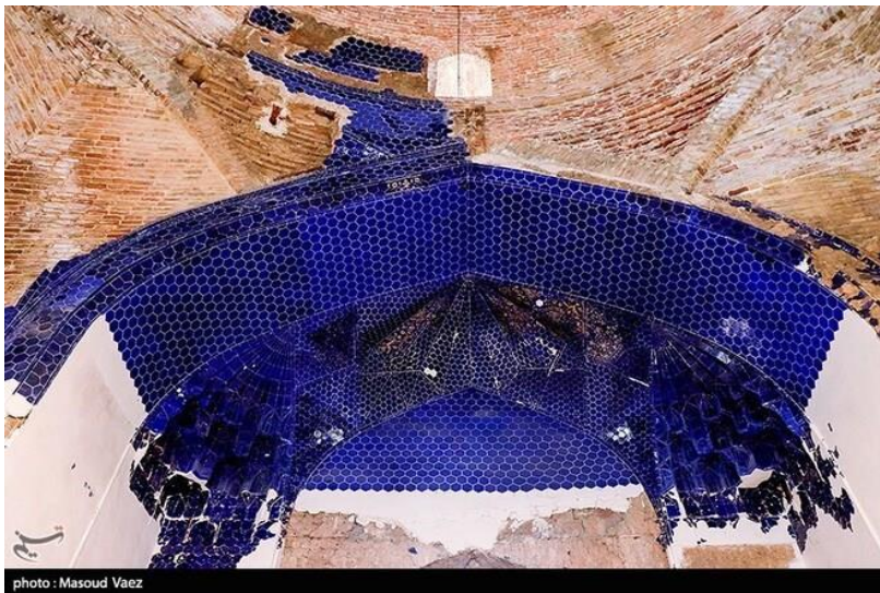
تصویر ۳. مقرنس کاری در مسجد کبود تبریز