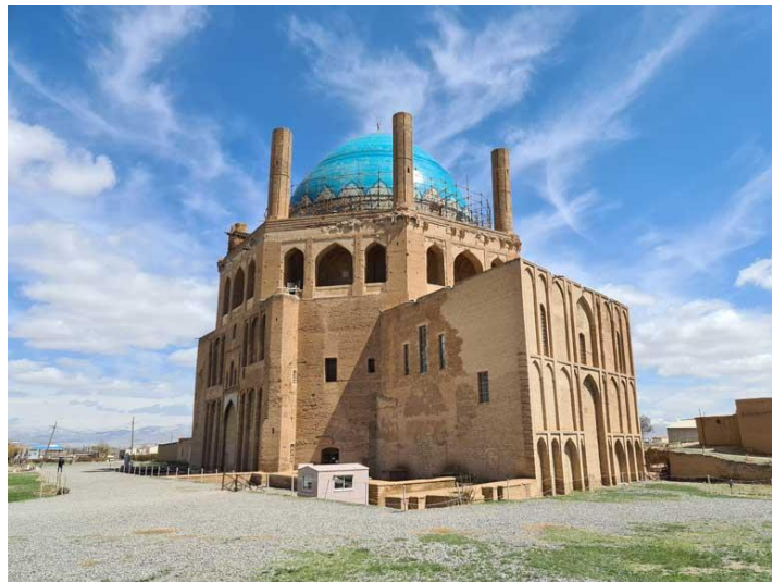
تصویر ۱. گنبد سلطانیه، دوره ایلخانیان

شاخص‌ترین اثر تمدنی ایران در عصر اسلامی با عنوان بلندترین گنبد آجری جهان ۷۰۰ سال است که در بین دشت وسیع بادخیزی با اقلیم سخت با عظمت و پایدار خودنمایی می‌کند. راز پایداری این بنا در میان جریان‌های هوایی حاصل از جغرافیای منطقه، بدون تردید ناشی از به‌کارگیری سازه‌ای کاملاً مهندسی شده بر پایه علم آیرودینامیک در معماری آن است. این علم امروزه جهت استقامت و پایداری بناها در سازه‌های عمرانی به‌کار گرفته می‌شود (میرحسینی و همکاران، ۱۴۰۱: ۵۹۶). سلطانیه بین سالهای ۷۰۳ تا ۷۱۳ هجری قمری به دستور سلطان محمد خدابنده در شهر سلطانیه که پایتخت ایلخانیان بود ساخته شد و از آثار مهم معماری ایرانی و اسلامی به‌شمار می‌رود. گنبد سلطانیه در آثار میراث جهانی یونسکو به ثبت رسیده است. این بنا اولین گنبد بزرگ آجری جهان قبل از گنبد کلیسای سانتا ماریا است که توسط مغول‌ها ساخته شده است.