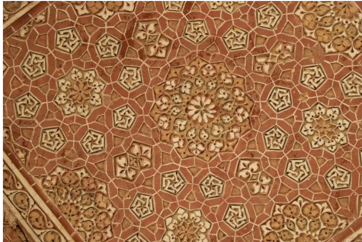
تصویر ۲. وحدت در نقوش تزئینی گنبد سلطانیه، دوره ایلخانیان

مضامین قرآنی، گواه دیگری بر تأیید نقش عرفان در آرایه‌پردازی‌های این اثر معماری است (کوره پز، بلیان، ۱۴۰۱: ۱۴۱). تصویر شماره ۲ از جمله نقوش هندسی و گیاهی در تزئینات معماری گنبد سلطانیه است که وحدت را به نمایش گذاشته است.