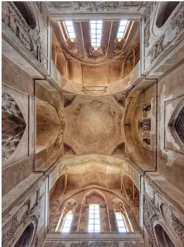
تصویر ۴. وحدت در فضای داخلی معماری گنبد سلطانیه

مفاهیم دینی اهل سنت، کاربری فضاها، آیات و احادیث قرآنی در غالب خطوط بنایی در آرایه‌های گنبد سلطانیه مؤثر بوده‌اند، دسته‌بندی می‌گردند (بلیلان و همکاران، ۱۴۰۱: ۵۷). تصویر شماره ۴، نمونه‌ای از حس وحدت در ساختار فضایی در گنبد سلطانیه را منعکس ساخته است.