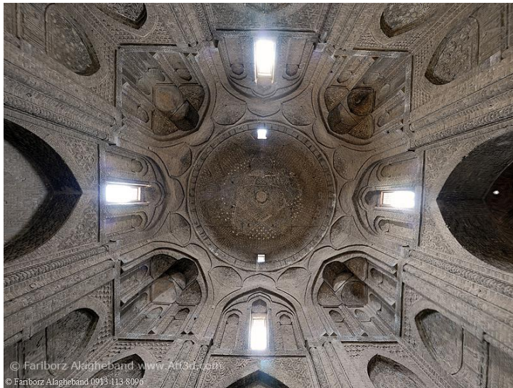
تصویر ۳. فضای داخلی گنبد تاج‌الملک، دوره سلجوقی

تاج‌الملک و سال ساخت اثر ۴۸۱ هجری بیان شده است. در زیر کتیبه ۳۲ پشت بغل وجود دارد که در هر کدام از آن‌ها ۲ کلمه به خط کوفی ساده با آجر نوشته شده است. در زاویه‌های داخلی گنبد تاج‌الملک پس از «بسم الله الرحمن الرحیم» آیه ۷۸ و ۷۹ سوره اسراء به خط کوفی ساده بر آجر برجسته نوشته شده است. کتیبه‌ای دیگر در ضلع جنوبی گنبد است که به خط کوفی ساده بر روی آجر برجسته «بسم الله الرحمن الرحیم» و آیه ۲۶ و ۲۷ سوره آل عمران نقش بسته است.