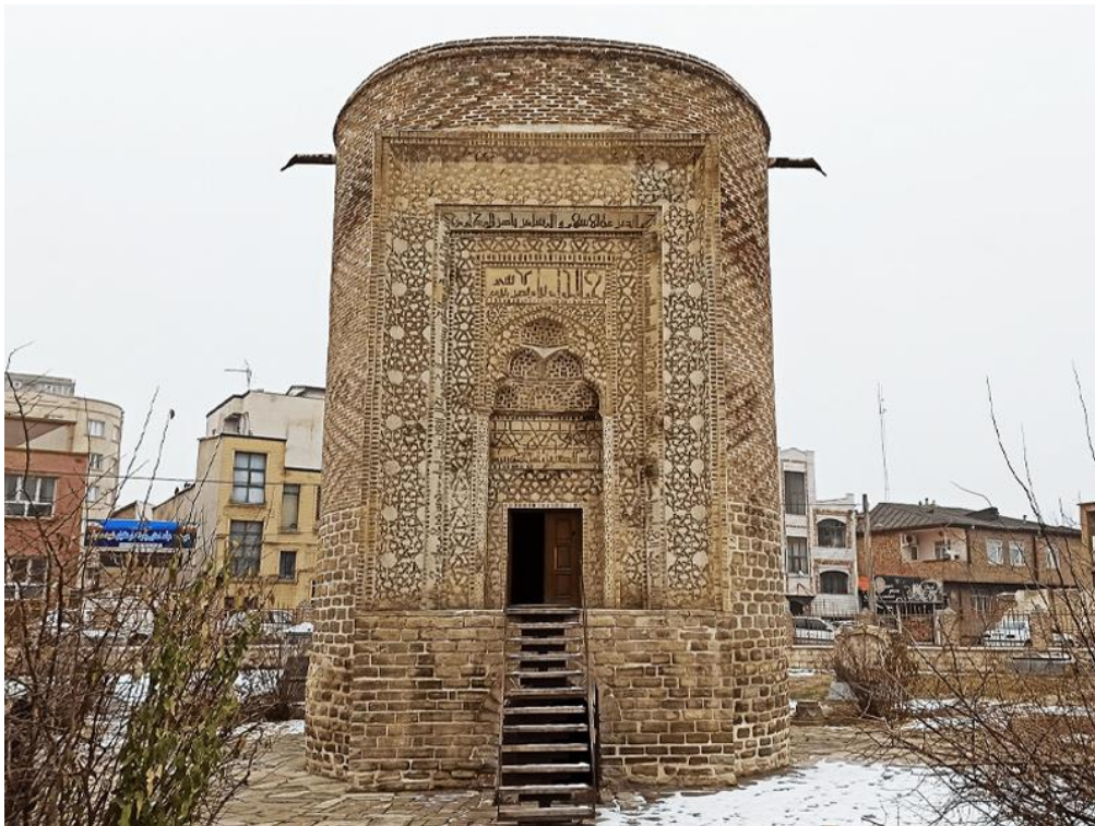
تصویر ۱. مقبره سه گنبد ارومیه. دوره سلجوقی

خوشنویسی والاترین هنر اسلامی به‌شمار می‌آید، زیرا وسیله‌ای برای تجسم کلام وحی است و به هنرهای دیگر صورت و معنای زیبا می‌بخشد. خوشنویسی اسلامی، به دلیل سادگی اجزای هر حرف که طبیعت آن را تشکیل می‌دهد، از کاربرد مناسبی در تزیین رویه اشیا فلزی برخوردار است؛ به‌ویژه این که به آسانی قابل ترکیب با سایر نقوش از جمله طومارهای اسلیمی نیز می‌باشد. از جمله ویژگی آثار فلزکاری سلجوقی وجود انواع نقوش تزیینی با مضامین گوناگون است، که در این میان هنر خوشنویسی اسلامی به‌صورت خط‌نگاره در این آثار از لحاظ محتوایی و زیبایی‌شناسی بصری بسیار قابل تأمل و تفکر می‌باشد.