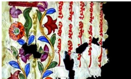
تصویر ۲. نقاشی مانوی