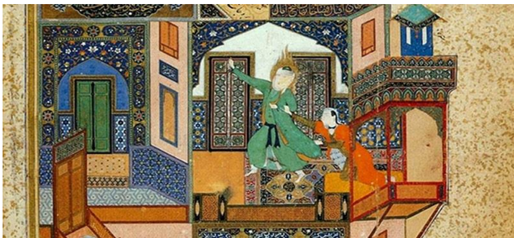
تصویر ۷. مکتب هرات اثر کمال‌الدین بهزاد

در هنر نگارگری مغولی- تیموری چهره‌ها مغولی است، دیگر خبری از عمامه‌های بزرگ عربی مکتب بغداد نیست. خط عنصر اصلی در بیان حالت است. نوعی اکپرسیو در بیان حالت چهره در برخی از نگاره‌ها دیده می‌شود. از دیگر عناصری که متأثر از هنر چینی وارد شد می‌توان به نحوی نمایش طبیعت مثلاً ترسیم تنه پیچیده و گره‌دار درختان و صخره‌های تیز و دشت‌های بریده و ابرهای موج، مراعات نسبت‌ها، دقت در رسم گیاهان و اعضای بدن حیوانات و تحرک و جنبش بیشتر در نمایش صحنه‌ها به‌جای آرامش و سکون موجود در نقاشی سنتی ایرانی اشاره کرد. (تصویر ۷)