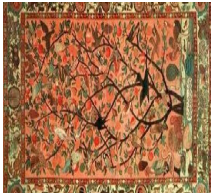
تصویر ۶. نمونه فرش دوره تیموریان

اوج نگارگری تیموری و تأثیر آن را می‌توان در دستاوردهای هنری دوره تیموری دید، فی‌المثل در نگارهای دوره تیموری اگر آن را شرح دهیم به دو نوع قالبی برمی‌خوریم که از طریق آن می‌توان تشخیص داد هنر به‌کار رفته در آن بر چه اسلوبی استوار است، قالبی‌هایی با طرح‌های هندسی و قالبی‌هایی با طرح‌های اسلیمی، امی بریگز (Amy Briggs) بررسی مراز اولی از این قالیچه‌ها انجام داده است نوع طرح‌های هندسی کهن‌تر است و گروهی عظیم را شامل می‌شود. قالبی‌های هندسی در اواخر سده نهم/ پانزدهم جای خود را به قالبی‌های اسلیمی و طرح‌های گیاهی داد که بهترین نمونه‌های آن را می‌توان در نگاره‌های بهزاد و مکتب او دریافت (کمبریج، ۱۳۸۷: ۳۷۴). (تصویر ۶)