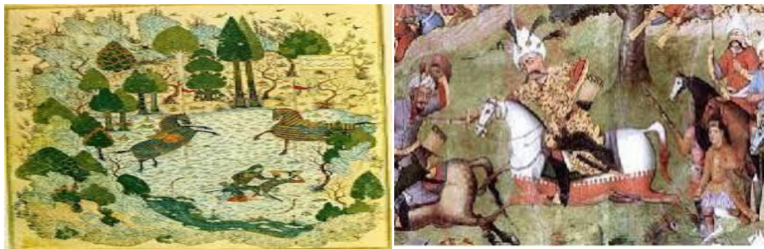
تصاویر ۳-۴. نگارگری در دوران تیموریان (مأخذ: حسن‌زاده، ۱۳۹۱)

ترکیب سبک‌های مختلف هنرمندان در نواحی پراکنده ایران با گرایش‌های فرهنگی تیموریان، محیط خلاق از هنرها را پدید آورد. بسیاری بر این عقیده‌اند که عالی‌ترین دستاورد هنرمندان عصر تیموری، هنر نقاشی و کتاب‌سازی و کتاب‌آرایی و جلدسازی است و در این دوره این هنر از وحدت و منطق یگانه برخوردار می‌شود. (تصاویر ۳-۴)