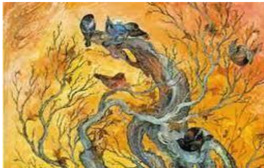
تصویر ۱. نقش گیاهان در نقاشی مانوی (مأخذ: هامبی و...، ۱۳۷۶)

مانی در شمار هنرمندانی است که برای اشاعه و حفظ و بقای کیش خود دست به نقاشی، خوشنویسی و نبیان‌نگاری (اصطلاح ویژه مانویان برای هنر تذهیب) زده بود (اسماعیل پور، ۱۳۸۱: ۴۰). مانویان تحت لوای مذهب به هنر نقاشی پرداختند (معمارزاده، ۱۳۸۸: ۳۲). هنر مانوی همچنان در فرهنگ ایرانی به‌عنوان نیروی پویا و پایدار به‌شمار می‌رفت (شیرازی، ۱۳۹۱: ۳۵). مانی و پیروانش برای بیان مفهوم آمیختگی نور و ظلمت و توصیف رستگاری روح و بهشت نور، از سنت کلامی و تصویری ارزشمندی بهره گرفتند که تا مدت‌ها در آسیای میانه برقرار ماند و سپس توسط سلجوقیان در سراسر ایران گسترده شد؛ چنانچه این جوهر زیباشناختی مانوی را حتی در نسخه‌های مصور سده‌های بعدتر نیز می‌توان تشخیص داد (پوپ، ۱۳۷۸: ۳۰). هنر مانوی تا آنجا که بقایای پراکنده مجال می‌دهد، اهمیتی ویژه و به‌گونه‌ای عاملی تحول‌زا در صورت‌بندی و انتقال نقش‌مایه‌ها، فنون و عقایدی داشت که برای هنر آینده ایران از اهمیتی برخوردار است (هامبی، ۱۳۷۶: ۴۷).