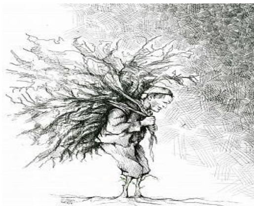
تصویر ۳. نقاشی اجتماعی با مضمون فقر. اثر: حسین رضایی

ژانر نقاشی اجتماعی براساس پیش‌زمینه‌هایی که مبداء شکل‌گیری هنرهای اجتماعی نظیر نقاشی یا ادبیات اجتماعی است، می‌تواند به بررسی و تحلیل آثار نقاشی که دارای مضامین و جهت‌گیری‌های اجتماعی است، بیانجامد.