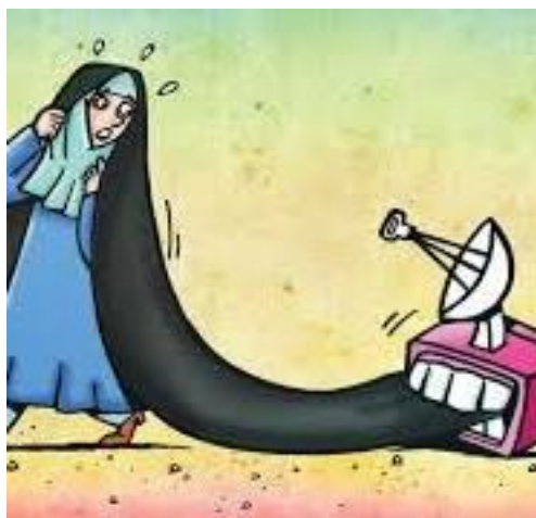
تصویر ۱. نمونه نقاشی با مضامین اجتماعی، هنرمند: نامشخص

هنر و هنرمند نقش بزرگی در حفظ ارزش‌ها، مقاصد انسانی و نشان‌دادن خواسته‌ها و رفتارهای اجتماعی دارند. آثار هنری متأثر از رخدادهای اجتماعی و فرهنگی از عوامل و وجوه مهمی هستند که اگر در مطالعات نشانه‌شناسی هنرها وارد شوند و مورد بررسی قرار گیرند بر غنای تبیین‌ها و دستاوردهای این‌گونه پژوهش‌ها خواهند افزود همچنین موجب شناخت و درک ساحت‌های فرهنگی و هنری جامعه می‌شوند. ترسیم مضامین اجتماعی در نقاشی معاصر می‌تواند به مثابه یک نوع هشدار اجتماعی دانست. تصویر شماره یک نمونه‌ای از این آثار در خصوص اهمیت رسانه‌ها در تحولات اجتماعی است.