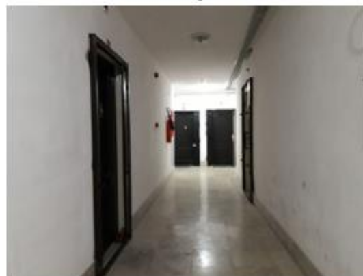
شکل ۶- راهروی طبقات در مجتمع مسکن مهر زیتون شهر پردیس، مآخذ: نگارندگان.