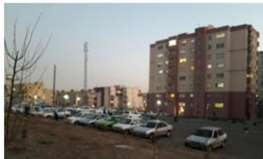
شکل ۴- فضای باز مجتمع مسکن مهر زیتون شهر پردیس، مآخذ: نگارندگان.