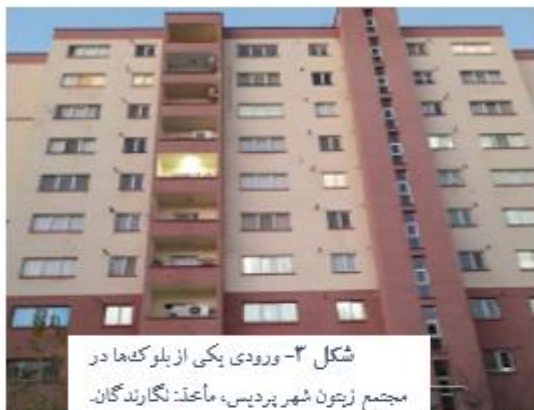
شکل ۳- ورودی یکی از بلوک‌ها در مجتمع زیتون شهر پردیس، مآخذ: نگارندگان.