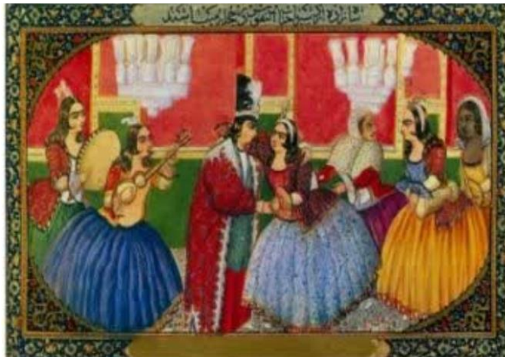
تصویر ۲. زنان در دربار قاجار. نسخه مصور هزار و یک شب صنیع الدوله. دوره قاجار. محل نگهداری: کاخ گلستان

این نقش آفرینی از مدیریت مسائل فرزندان، امور تغذیه، رسیدگی به نظم خانه متغیر بوده است. این حضور مختص منازل عامه نبود بلکه در دربار نیز زنان نقش‌های متعددی را در این دوره برعهده داشتند. تصویر شماره ۲ و ۳ نمونه‌هایی از این حضور را ترسیم کرده است.