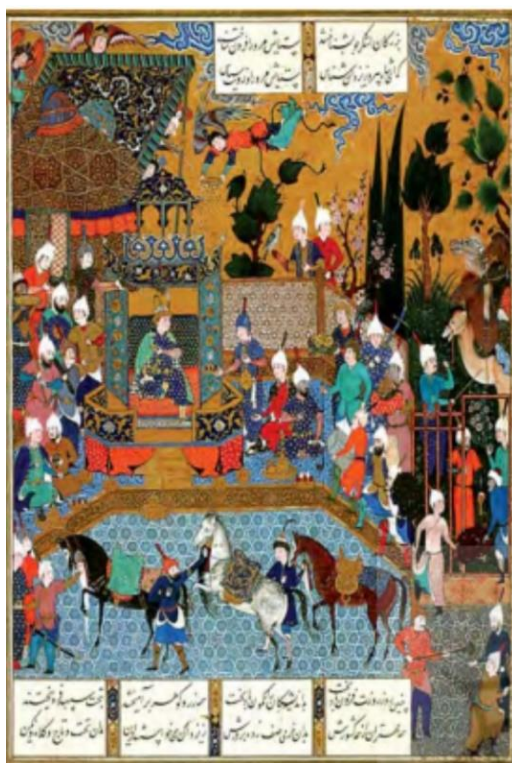
تصویر ۳. دربار فریدون، منسوب به قدیمی با مدیریت سلطان محمد. شاهنامه شاه‌طهماسبی.

طبق آنچه در شاهنامه و اوستا آمده است، فریدون دارای فره ایزدی بوده است که این فره می‌تواند گواهی بر پیامبری و موبدی او باشد. فردوسی در شاهنامه بر این باور است که در زمان فریدون جهان از بدی به دور گشت و همه راه ایزدی پیش گرفتند که این نیز با اینکه اشاره مستقیم به موبدی و پیامبری فریدون نیست، ما اشاره‌ای غیرمستقیم به آن است. تصویر شماره ۳ نیز دربار فریدون را در شاهنامه شاه‌طهماسبی نشان می‌دهد.