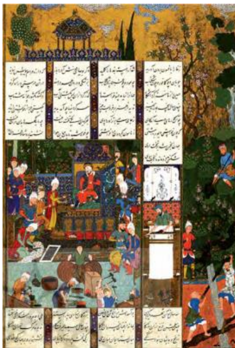
تصویر ۲. درباره جمشید. منسوب به سلطان محمد. شاهنامه شاه‌طهماسبی

تصویر شماره ۲ از شاهنامه شاه‌طهماسبی درباره جمشید را نشان می‌دهد.