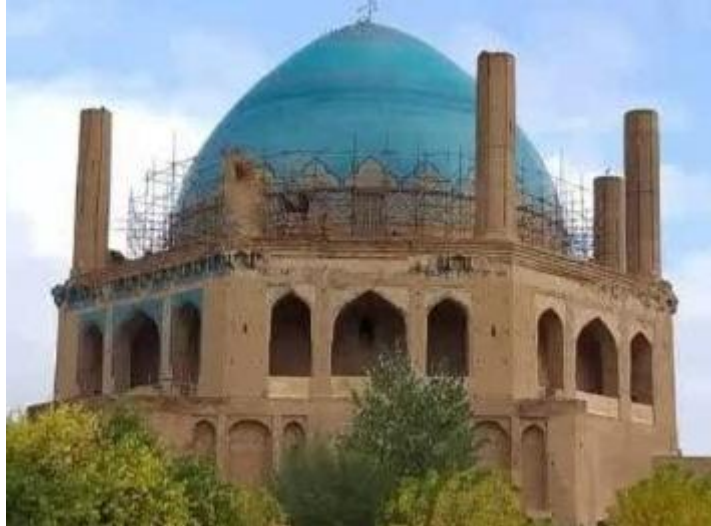
تصویر ۱. گنبد سلطانیه. دوره ایلخانی

در دوره ایلخانی، سلطان محمدخدا بنده شیعه شد و در بناهای دوره وی می‌تواند نمودهای تشیع را مشاهده کرد. بنای سلطانیه یکی از آثار این دوره است که در آن کتیبه‌هایی با مضمون ترویج تشیع مشاهده می‌شود. تصویر شماره ۱، این بنای تاریخی را نشان می‌دهد.