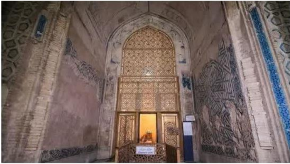
تصویر ۲. فضای داخلی بنای سلطانیه. دوره ایلخانی

در گنبد سلطانیه با استفاده از خطوط تزئینی سه مفهوم مهم به بیننده القا می‌شود: کلمه «الله» به‌عنوان علت غایی جهان هستی، کلمه «محمد» به‌عنوان بنیان‌گذار مکتب و کلمه «علی» به‌عنوان مظهر حکومت عدل الهی. هنرمندان برای تزئین گنبد سلطانیه از خط بنایی استفاده کرده‌اند. آن‌ها کلمات الله، محمد و علی را با ترکیب کاشی الوان (هفت رنگ) و رنگ سرد در جای‌جای این بنا حتی در بدنه مناره‌ها به کار گرفته‌اند. دیواره‌های ایوان‌های داخلی نیز مزین به کلمات الله، محمد و علی هستند؛ کلماتی که با ترکیب کاشی آبی و آجر ساخته شده‌اند.