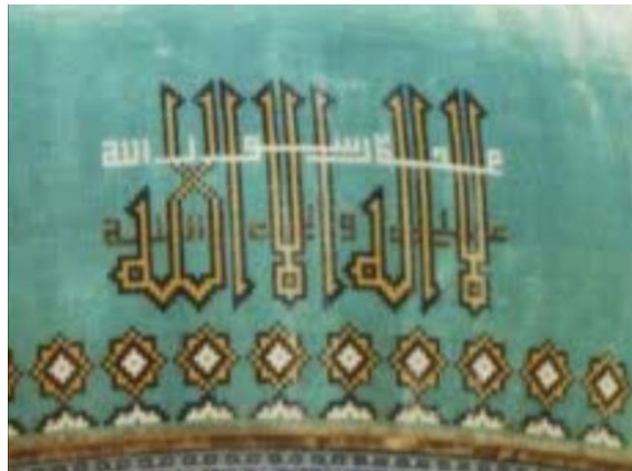
تصویر ۴. شهادتین شیعی بر روی گنبد مسجد گوهرشاد

در دوره تیموریان، تشیع بیشتر مورد توجه بود و بازتاب آن را می‌توان در کتیبه‌های بناهای این دوره مشاهده کرد. بدون شک از مهم‌ترین بناهای این دوره مسجد گوهرشاد، آرامگاه خواجه عبدالله انصاری و مسجد جامع ورزنه است. در این بناها می‌توان در آن جلوه‌های تشیع را مشاهده کرد.