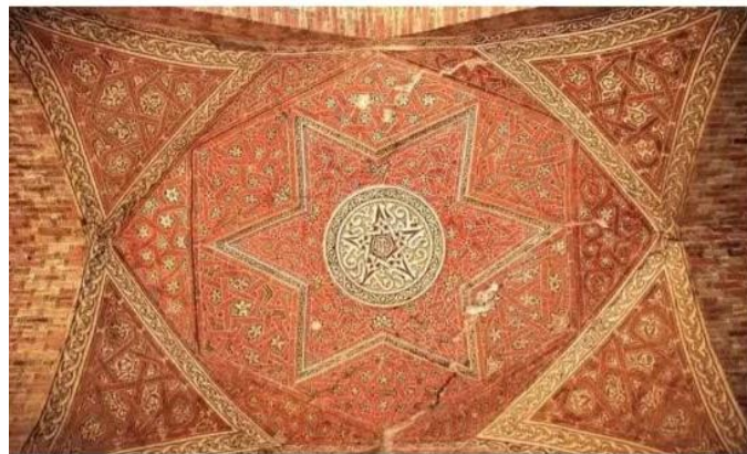
تصویر ۳. تزئینات گنبد سلطانیه دوره ایلخانی

در گنبد سلطانیه با استفاده از خطوط تزئینی سه مفهوم مهم به بیننده القا می‌شود: کلمه «الله» به‌عنوان علت غایی جهان هستی، کلمه «محمد» به‌عنوان بنیان‌گذار مکتب و کلمه «علی» به‌عنوان مظهر حکومت عدل الهی. هنرمندان برای تزئین گنبد سلطانیه از خط بنایی استفاده کرده‌اند. آن‌ها کلمات الله، محمد و علی را با ترکیب کاشی الوان (هفت رنگ) و رنگ سرد در جای‌جای این بنا حتی در بدنه مناره‌ها به کار گرفته‌اند. دیواره‌های ایوان‌های داخلی نیز مزین به کلمات الله، محمد و علی هستند؛ کلماتی که با ترکیب کاشی آبی و آجر ساخته شده‌اند.