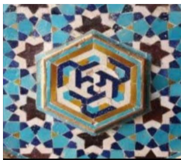
تصویر ۶. تکرار نام علی (ع) در کتیبه مسجد جامع ورزنه