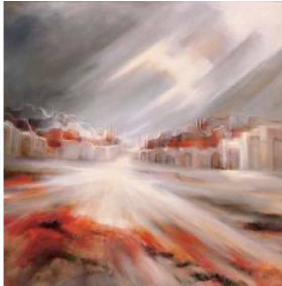
تصویر ۲. نقاشی بهت دشت. اثر ایران درودی، نقاش معاصر، ایران