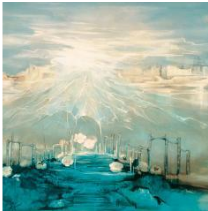
تصویر ۱. نقاشی به زلالی یک عشق، اثر ایران درودی، نقاش معاصر، ایران

بررسی نمونه‌های موردی از تخیل در نقاشی معاصر ایران، تأییدی بر کاربست و اهمیت این رویکرد در زیبایی آثار خلق شده است. تصویر شماره ۱ و ۲ نمونه از آثار ایران درودی نقاش معاصر ایرانی است که عنصر خیال نقش محوری در هویت آثار وی دارد.