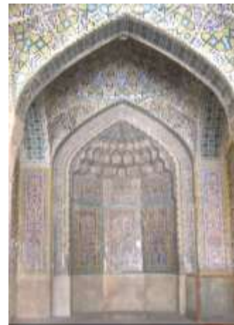
تصویر ۱۵، محراب مسجد وکیل

منبر از دیگر عناصر نمادین مساجد است. منبر مسجد وکیل که در شبستان جنوبی قرار دارد یکی از نمونه‌های بارز این نماد است. در مورد معانی نمادین این منبر می‌توان گفت: «شکل نمادی منبر نشانه‌ی تقدس شخصیتی بود که در زیر آن می‌نشست و شکل نمادی پله‌ها به مفهوم نردبان جهان است که از مراحل دنیوی و روحانی می‌گذرد و به روح مطلق می‌انجامد. واعظ و خطیب به هنگام بالا رفتن از منبر، درواقع ارتباط از مادیات و زمین می‌کند و به ملکوت اعلیٰ عروج می‌نمود» (زرگر، ۱۳۸۶، ۵۲). (تصویر ۱۷)