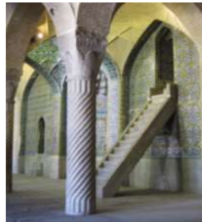
تصویر ۱۶، منبر مسجد وکیل

وقتی نمادهای عرفانی و نمادهای ساختاری در کار هنرمند دلالت های تازه تری را آشکار سازد، نشان دهنده این موضوع است که عمل سازنده آن برگرفته از اندیشه ها و تجربه های عرفانی - هنری وی است، نه تقلید از هنرمندان