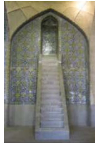
تصویر ۹، کتیبه‌نگاری منبر مسجد وکیل

بر اساس آنچه پیش‌تر در مورد تعریف پیرس از فرآیند نشانگی آورده شد می‌توان گفت، کتیبه‌ها به این علت جزء نشانه‌های نمایه‌ای می‌توانند قرار بگیرند که بازمودی هستند که دلالتشان به موضوعشان، نه از طریق قیاس و نه به دلیل پیوند آن با ویژگی‌های عامی که موضوع آن ممکن است داشته باشد، بلکه به دلیل ارتباط پویا و همچنین فضایی است که از یک سو با موضوع دارند و از سوی دیگر به افراد و واحدهای منفرد دلالت می‌کنند.