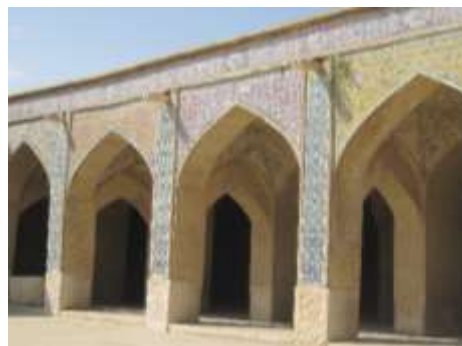
تصویر ۷، طرح تزئینی اسلیمی در کاشی کاری طاق نمای مسجد وکیل (مأخذ: نگارندگان)

در هردوی این تصاویر گل‌ها و پیچک‌های به‌هم‌پیچیده شده به‌عنوان نشانه‌های شمایی به‌کاربرده شده که موضوع تصویر آن گل است، شباهت تصویر گل بانام آن گل در بهشت که مدلول است، خود مجدداً دالی است که مدلول آن این است که گل‌ها پیوسته نشانی از بهشت خداوند است. این مدلول دوباره به دال تازه‌ای بدل می‌شود که مدلول آن این است که همه موجودات نشانه خداوند هستند و این روند همان‌طور که پیش‌تر اشاره شد مصداق گفته پیرس است که معنای بازنمود، بازنمودی دیگر است و به همین ترتیب تا بی‌نهایت ادامه می‌یابد و از این‌رو معنای نشانه دست‌یافتنی نیست.