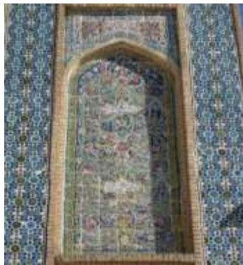
تصویر ۱۴، رنگ‌بندی متنوع در کاشی‌کاری مسجد وکیل

استفاده از چندین رنگ در کاشی‌کاری مسجد وکیل که نظر هر بیننده‌ای را به خود جلب می‌کند نیز رمز و نماد غنای آفرینش و دیگر جنبه روح پیامبر اکرم (ص) است که تجلی و بازتاب غنای پایان‌ناپذیر خزائن الهی است که هر لحظه در کار خلق است و امکانات بی‌پایان آن هرگز نقصان نمی‌پذیرد (تصویر ۱۴).