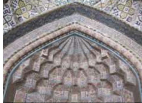
تصویر ۱۰، مقرنس کاری محراب مسجد وکیل

بررسی نشانه‌های اسلامی تنها به نقوش اسلامی اختصاص ندارند. حتی آداب و رسومی هم که مسلمانان انجام می‌دهند، می‌تواند نوعی نشانه باشد. به‌عنوان نمونه آیین نماز نشانه‌ها شدن روح و پیوستن به معبود است. هنگامی که به نماز می‌ایستیم هزاران مفهوم و معنا را با معبود خود مرور می‌کنیم. تکبیره‌الاحرام می‌گوییم و به وحدانیت آن ذات بی‌شریک اعتراف می‌کنیم. قنوت می‌بندیم، دست‌ها و انگشتان خود را به‌سوی بالا می‌بریم و بر صفات جمالیه و جلالیه آن بزرگ گواهی می‌دهیم. به‌واسطه این اقامه نماز، سعی در تزکیه نفس و اخلاق می‌کنیم. جسم خود را از آلودگی‌های جسمانی و روح خود را از آلودگی‌های روحی می‌زداییم. همچنین دیگر بخش‌های آیین‌های اسلامی، هرکدام نشانه‌های قابل تأویل محسوب می‌شوند (مصدری، ۱۳۸۵، ۱۰).