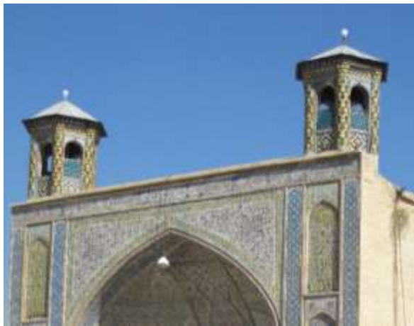
تصویر ۱۶، گلدسته‌های مسجد وکیل

گلدسته‌های مسجد وکیل در سمت شمال قرار دارد و با کاشی‌کاری‌های زیبا تزئین شده است. این گلدسته‌ها در سنت اسلامی در حد نمادپردازی، نمایشگر محور هستی آدمی است از آن بعد که در ظاهر انسان تنها وجودی است که بر روی دو پا به‌صورت عمودی می‌ایستد و راه می‌رود و از جنبه باطنی یادآور روح انسان است که در پی تعالی و توجه به عالم بالاست برای بازگشت به خاستگاه ازلی‌اش (تصویر ۱۶).