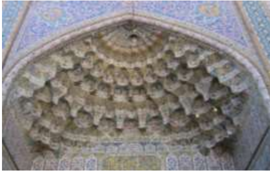
تصویر ۱۱، مقرنس کاری سردر ورودی مسجد وکیل

آن‌ها (نمایه‌ها) توجه را از طریق نوعی اجبار کور به موضوع‌های شان جلب می‌کنند؛ جزء نشانه‌های نمایه‌ای به‌حساب می‌آیند ولی کیفیت نشانه‌های نمادین را هم دارند.