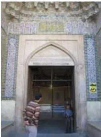
تصویر ۱۷، سردر ورودی مسجد وکیل

از آنجاکه گذر از هر مرحله همانند عبور از در است، از این رو می توان در را نماد گذر دانست و به دلیل این ویژگی نمادین در که عبور از ناپاکی ها و ورود به مکانی پاک است، آداب ورود به این حریم نیز نمادین است و معمولاً عبور از در با یاد خدا آغاز می شود. لذا ورود به مسجد نیز که بالاترین مکانهاست آداب خاصی دارد و ورود به آن باید با پای راست باشد چراکه جایگاه فرشته نیکی ها در طرف راست است.