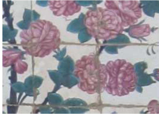
تصویر ۳، نمونه کاشی کاری ایوان مسجد وکیل