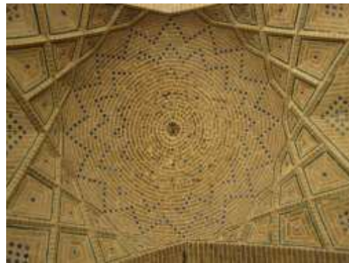
تصویر ۱۳، آجرکاری‌های مسجد وکیل