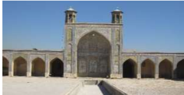
تصویر ۱، مسجد وکیل شیراز تصویر ۲، پرسپکتیو مسجد وکیل