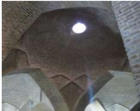
تصویر ۱۲، هورنو های تعبیه شده در شبستان شرقی مسجد وکیل

به کاررفته است، باین حال کاربرد آن برای هنرمندان متفاوت است. «هنرمندان مسلمان به خوبی می‌دانند که نور را چگونه جذب کنند و به هزاران طریق مختلف درخشان و مشعشع سازند.» (بورکهارت، ۱۳۸۶، ۱۱۴). یکی از نکاتی که توسط معماران ایرانی مورد توجه قرار گرفت، توجه به نور است. می‌توان به تبیین و توصیف این نماد عرفانی (نور) در مسجد وکیل پرداخت و با استفاده از بیان و روایت، مدلول را برای خواننده آشکار کرد. شخصی که در این مسجد وارد می‌شود در جای جای این فضا، ضمن تحت تأثیر قرار گرفتن از نحوه نورپردازی داخل بنا، حضور خداوند را متوجه می‌شود و این دلیلی است بر آن که به واسطه هنر طراحی فضا توسط معمار به صورتی که در آن با تغییرات تناسب فضا و نور و رنگ و سایر عناصر دخیل در فضایی معماری، علاوه بر ایجاد روشنایی کافی، احساس معنویت، فضایی روحانی و نیل به ملکوت را در بازدیدکننده تحریک می‌کند. در شبستان شرقی مسجد وکیل برای نور رسانی، هورنو ۱۰ هایی در سقف تعبیه شده است که با ایجاد فضایی ابهام‌آور، نمازگزار را به تفکر و تمرکز وامی‌دارد (تصویر ۱۲).