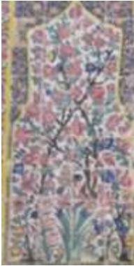
تصویر ۴، نمونه کاشی کاری محراب مسجد وکیل