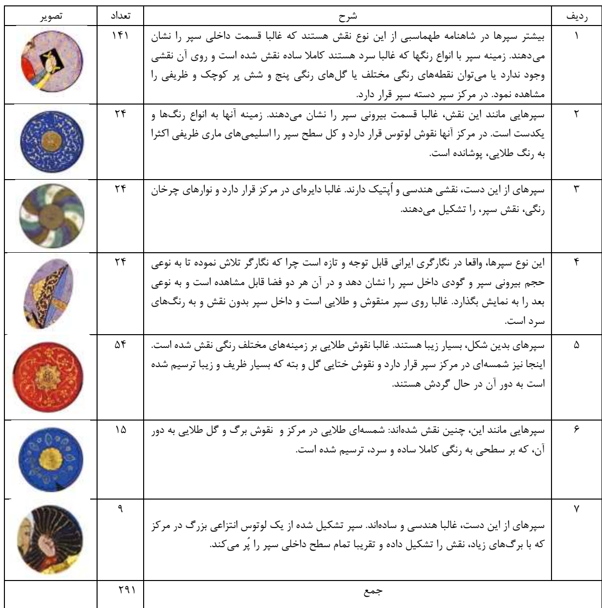
جدول ۲: بررسی نقوش سپرهای جنگی در شاهنامه طهماسبی

شیوه ترسیم سپر در شاهنامه طهماسبی بایست به سه قسمت تقسیم شود؛ سپرهایی که قسمت داخلی آنها قابل رویت است، سپرهایی که قسمت بیرونی آنها قابل مشاهده است و سپرهایی که همزمان قسمت داخلی و قسمت بیرونی را نشان داده و به صورت نیمرخ ترسیم شده‌اند. بیشتر سپرهای کارشده در شاهنامه طهماسبی، قسمت داخلی سپر را نشان می‌دهند. اینجا قسمت داخلی، فاقد نقش نیست اما مانند شاهنامه بایسنقری، نسبت به قسمت بیرونی، نقش بسیار کمتری دارد و عموماً کم نقش، کار شده است. چنانچه نقوش روی سپر این شاهنامه، نیز به سه دسته هندسی، گیاهی و حیوانی تقسیم شود؛ بیشترین سهم را نقوش گیاهی به خود اختصاص خواهند داد و بعد از آن نقوش هندسی و اصلاً نمونه نقش حیوانی در این شاهنامه وجود ندارد. از آنجایی که ۶۶ نگاره سپردار شاهنامه طهماسبی ۲۹۱ سپر دارد و در این مقاله، مجالی برای بررسی نقوش تک تک این سپرها نیست؛ نگارنده سعی کرده تا سپرهای مشابه را در یک ردیف آورده و آنها را در قالب جدول ۲، بررسی و توضیح دهد.