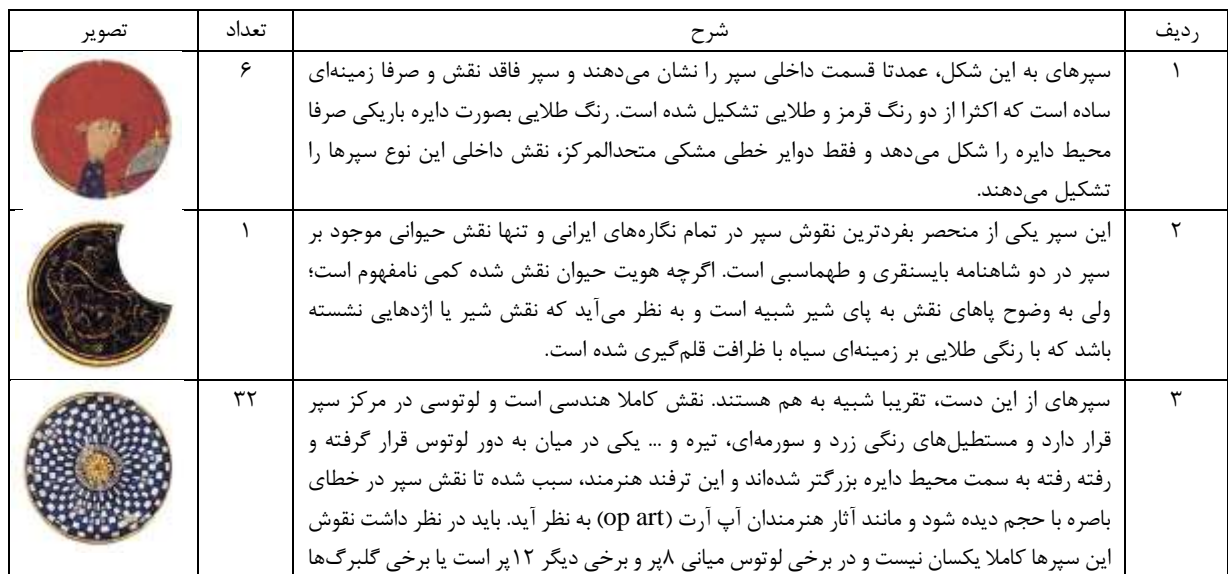
جدول ۱: بررسی نقوش سپرهای جنگی در شاهنامه بایسنقری

اگر شیوه ترسیم سپر به دو قسمت تقسیم شود؛ سپرهایی که قسمت داخلی آنها قابل رویت است و سپرهایی که بیرون آن پیداست؛ بیشتر سپرهای منقوش در شاهنامه بایسنقری، قسمت بیرونی سپر را نشان می‌دهند و جالب توجه است که قسمت داخلی، نقش خاصی ندارد و عموماً قسمت بیرونی منقوش ترسیم شده است و چنانچه کلیت نقوش روی سپر به سه دسته هندسی، گیاهی و حیوانی تقسیم شود؛ بیشترین سهم را نقوش هندسی به خود اختصاص خواهند داد و بعد از آن نقوش گیاهی و تنها یک نمونه نقش حیوانی قابل مشاهده است. از آنجایی که ۸ نگاره سپردار شاهنامه بایسنقری ۵۹ سپر دارد و بررسی نقوش تک تک این سپرها در این مقاله نمی‌گنجد؛ نگارنده سعی کرده تا سپرهای مشابه را در یک ردیف آورده و آنها را در قالب جدول ۱ بررسی نموده و توضیح دهد.