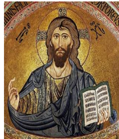
تصویر ۱: مسیح قادر مطلق (pantocrator)