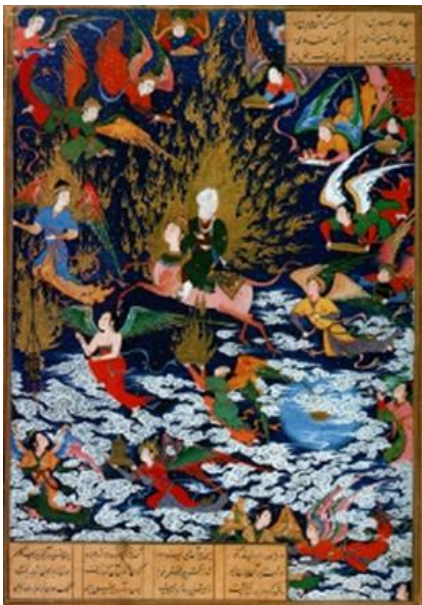
تصویر ۴: معراج پیامبر اسلام، سلطان محمد،

محض می داند؛ که درخشش و تابش آن بر عرصه نگاره موجب می گردد عناصر و پیکره ها به سان جلوه ها و مظاهر هستی در کثرت تجلی اسماء و صفات به ظهور آیند، به دیگر سخن در حالت تشبیهی عناصر مثالی موجود در نگاره به واسطه تابیدن نور واحد و به دور از کدورت سایه روایتگر جلوه های تجلی الهی در عالم نگارگری می گردند. این عمل نگارگر مسلمان در نگرشی موازی با آراء ابن عربی در جمع واژگان تشبیه و تنزیه می باشد، از آن جهت که در هر دو رویکرد، حق در مقام تجلی از خلق جدا نیست. به دیگر سخن همان گونه که در آراء بلخاری نور معادل اسم الله است، در نگارگری نیز با تابیدن نور وجودی واحد بر آینه موجودات در انواع رنگ های درخشان به دور از هر گونه کدورت سایه، نمایانگر کثرتی از صور ممکنات در عرصه هستی است؛ که جلوه گر نگاه ملکوتی نگارگر به ویژه در دوره هایی است که نگرش عرفانی حاکم بر جامعه، مادی گری صرف در مقام کثرت ها را با وحدت معنا و دریافت حقایق هستی در آمیخته و به تبع این تفکر، نگارگر نیز به دنبال مصور سازی حقایق متعالی عناصر هستی؛ نگاهش در کاربرد نور، رنگ، سطوح، زمان و مکان متفاوت و متعالی می شود.