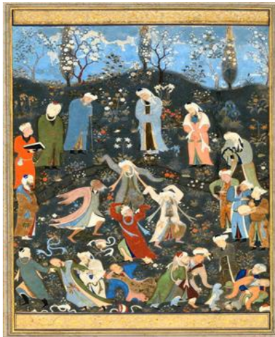
تصویر ۲: سماع درویشان، منسوب به بهزاد، حدود ۸۹۵ هجری

به کار گیرد که تمثیل این سخن در نگرش عرفانی؛ واصل شدن قطره به دریا و حرکت از سوی کثرت عالم امکان به سوی وحدت حق سبحانه است. لذا در سنت نگارگری ایرانی _ اسلامی بنابر آموزه تنزیه؛ عمل نگارگری مقدس نیست و جلوه های تصویری اشکال در آن، که با رنگ های متعدد درخشان و به دور از سایه و قوانین تصویری عالم مادی مصور می شوند؛ به کشف و شهودی اشاره دارند که بر اساس رویکرد تشبیهی، توسط بصیرت نگارگر بر زیبایی های خلقت الهی به اجرا در می آید(تصویر ۲)؛ که به عقیده نصر «نتیجه باز شدن چشم دل هنرمند و رسیدن او به مقام شهود است»(نصر، ۱۳۸۲: ۶).