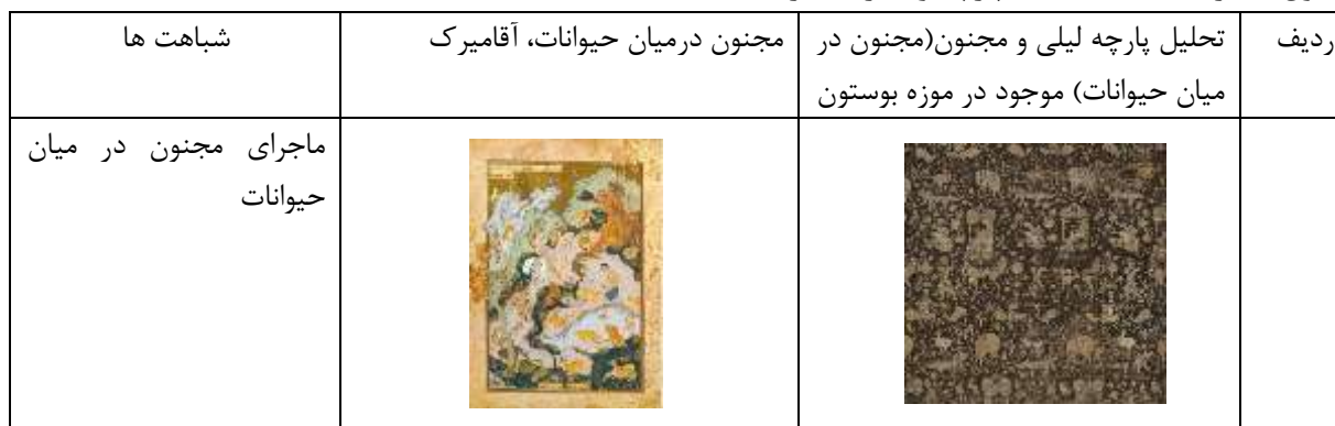
جدول شماره ۱ - شباهت‌های پارچه و نگاره (نگارنده، ۱۳۹۶)

عنوان مقاله: بررسی تطبیقی داستان نگاره مجنون در میان ددان خمسه طهماسبی با نگاره پارچه مضبوط در موزه بوستون به شماره ثبت ۱۹۲۸،۲، بر اساس نظریه بینامتنیت