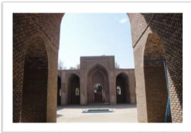
تصویر ۷: ایوان شرقی مسجد جامع ورامین