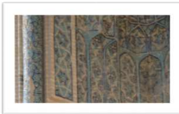
تصویر ۹: شمسه هشت پر با آجر معقلی در سردر شمالی مسجد، نگارندگان)

شمسه نماد کثرت در وحدت و وحدت در کثرت است. کثرت تجلی صفات خداوند است که در این نقش به صورت اشکال کثیر ظهور کرده است که از مزکزی واحد ساطع شده اند. این نقش چنان که از نام آن پیداست مفهوم نور را تداعی می کند. بنابراین