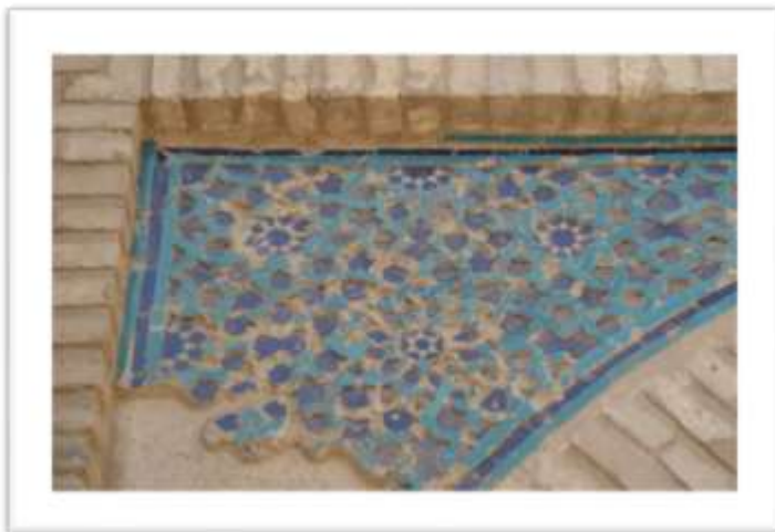
تصویر ۸: آرایه های هندسی همراه یا هنر آجر کاری و کاشی کاری

نقش هشت ضلعی و شمسه (تصویر ۹) در ایوان جنوبی و سردر مسجد جامع ورامین به وفور بکار رفته است که در هنر اسلامی دارای معانی و مفاهیم فراوانی است از جمله به عنوان نماد الوهیت و نور وحدانیت بکار می رود (خزایی، ۱۳۲: ۱۳۸۱).