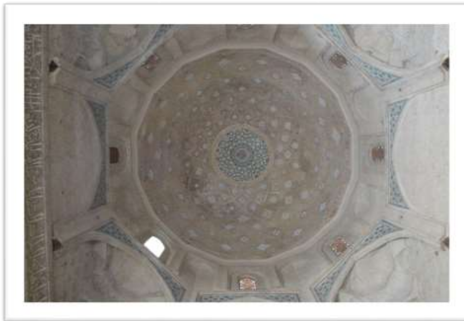
تصویر ۶: تزئینات گنبد خانه مقصوره

ایوان غربی، ایوان شرقی و ورودی غربی مسجد کم ارتفاع و دارای آرایه های کمتری است (تصویر ۷). در سفر نامه دیولافوا به پوسته مینایی خارج گنبد مسجد اشاره شده که در حال حاضر اثری از آن مشاهده نمی شود (دیولافوا، ۱۳۹۰: ۱۶۴). از نمونه های مساجد شاخص که قابل مقایسه با مسجد ورامین است می توان مسجد جامع زواره را نام برد (ویلبر، ۱۳۶۵: ۱۷۰).