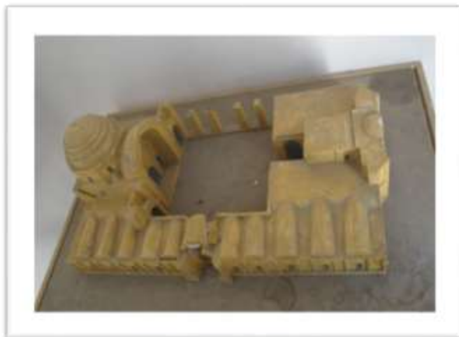
تصویر ۳: ماکت مسجد جامع ورامین

بنا بر کاوش هایی که در شبستان غربی مسجد بین سال های ۱۳۴۵-۵۴ انجام گرفت، شواهدی بدست آمد که احتمالاً به علت سیل قسمت هایی از مسجد به ویژه جبهه غربی تخریب گردیده است (فرحانی، ۱۳۸۱: ۴۴). بنابراین این آسیب ها باعث از دست رفتن دو مناره، و بخشی از رواق های غربی شده است که در سال های اخیر در نتیجه کاوش های باستان شناسی برخی از پایه های ضخیم آن از دل خاک بیرون آورده شده است (شیبانی و همکاران، ۱۳۶۵: ۴۹). در سال های اخیر سازمان میراث فرهنگی به مرمت و بازسازی قسمت های مختلف از بین رفته پرداخته است. بخش های مرمت شده همان قسمت هایی هستند که در فاصله زمانی بین اواخر دوره تیموری تا زمان مرمت آن ها به تدریج تخریب شده بودند (شیبانی، ۱۳۶۵: ۴۷-۵۰). بدین ترتیب وضعیت کنونی مسجد شامل اطراف میانرای مربع شکل آن که حوضی در میان دارد چهار ایوان به همراه رواق های، (تصویر ۳)