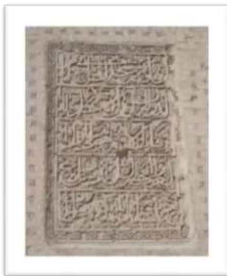
تصویر ۲: کتیبه ایوان جنوبی مسجد جامع ورامین

کتیبه سر در مسجد تاریخ ۷۲۲ و کتیبه زیر گنبد سال ۷۶۵ ه.ق را نشان می دهد (کیانی، ۱۳۶۸: ۲۳۷). مسجد در زمان الجایتو به بنایی حکومتی که تحت تاثیر تفکرات شیعی حاکمان بود تبدیل شد. این مسجد در گذر زمان از گزند حوادث روزگار مصون نبوده و بارها تخریب شده و دوباره مرمت شده است، از جمله در کتیبه ای در ایوان جنوبی شرح تعمیرات شاهرخ تیموری آورده شده است (تصویر ۲).