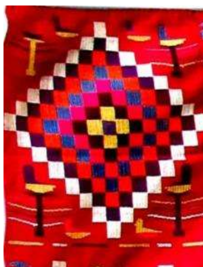
تصویر ۱۳. پرنده بر فراز درخت