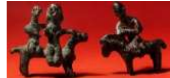
تصویر ۴، مجسمه اسب و سوار، برنز، املش، اوایل هزاره اول ق.م (Mahboubian, 1997: 218)