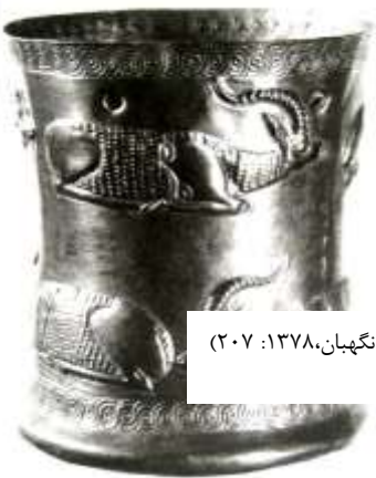
تصویر ۱۰ بز کوهی آرمیده، جامی از مارلیک (نگهبان، ۱۳۷۸: ۲۰۷)