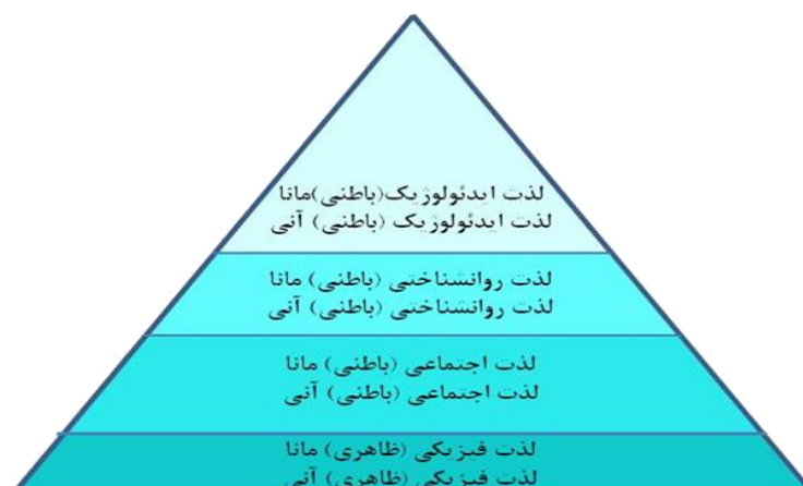
شکل ۸. نمودار سلسله‌مراتب لذت در محیط

نتایج این پژوهش نمایانگر این است که فضای دانشکده هنر و معماری یزد به لحاظ وجود مؤلفه‌های لازم برای تحقق لذت معماری بسیار غنی است. لذت معماری در این فضا، از نوع حسی و عقلی بوده و در قالب چهار گونه لذت فیزیکی، لذت روان‌شناسی، لذت اجتماعی و لذت ایدئولوژیک قابلیت بروز و ظهور دارد. در خصوص لذت بصری، مصادیقی در جهت تأیید وجود تمام مؤلفه‌های موردنظر هیلدبراند شامل؛ اصل لذت در چشم‌انداز به سمت آب، پناهگاه و چشم‌انداز داخلی، کاوش، محیط اغواکننده، مخاطره، هماهنگی شناختی، تازگی محرک و پیچیدگی و نظم به فراوانی در تمامی سکنس‌های بصری دانشکده معماری قابل مشاهده و درک است. دانشجویان براساس گونه طبیعی خود از مراتب مختلف لذت معماری بهره‌مند می‌شوند؛ در نتیجه ادراک لذت معماری به زیبایی‌شناسی محیطی دست می‌یابند که در روند آموزش معماری آن‌ها بسیار مفید خواهد بود.