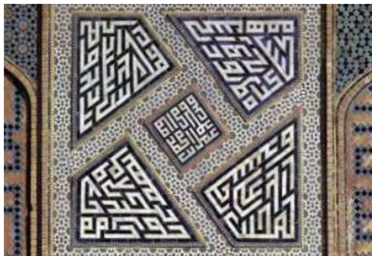
تصویر ۸- حیاط مسجد جامع اصفهان. (شایسته فر، ۱۳۸۴: ۱۷۵)