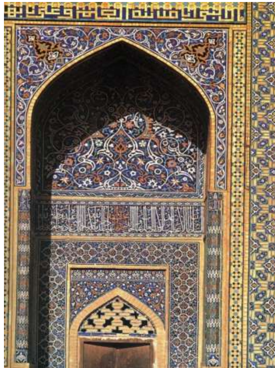
تصویر ۵- "آنا مدینه العلم و علی بابها"، مسجد جامع اصفهان.

"خوشنویسی" در مقام شاخصترین هنر اسلامی ریشه در معنویت دارد. خوشنویسی اسلامی بیان مادی و زمینی مفاهیم آسمانی است. به بیانی، خوشنویسی اسلامی تجلی حقیقت معنوی کلام الهی است. خوشنویسی اسلامی راز و رمز معنوی و روحانی در خود می‌پروراند. این هنر تجلی گاه امری قدسی است و بیش از هر جایی بر بستر کتیبه‌هایی در معماری نمود دارد. از این رو؛ کتیبه‌نگاری به واسطه‌ی هم راستا و هم سو شدن با خوشنویسی و به عنوان بستری برای نمایش و ظهور مفاهیم معنوی و الهی در قالب خط در معماری اسلامی، دارای قداست و تقدس بوده است. در معماری اسلامی کتیبه‌های با مضمون ادعیه انعکاس مفاهیم الهی هستند. از آن نمونه است کتیبه با مضمون دعای جوشن کبیر در محراب مسجد حکیم اصفهان. (تصویر ۶)