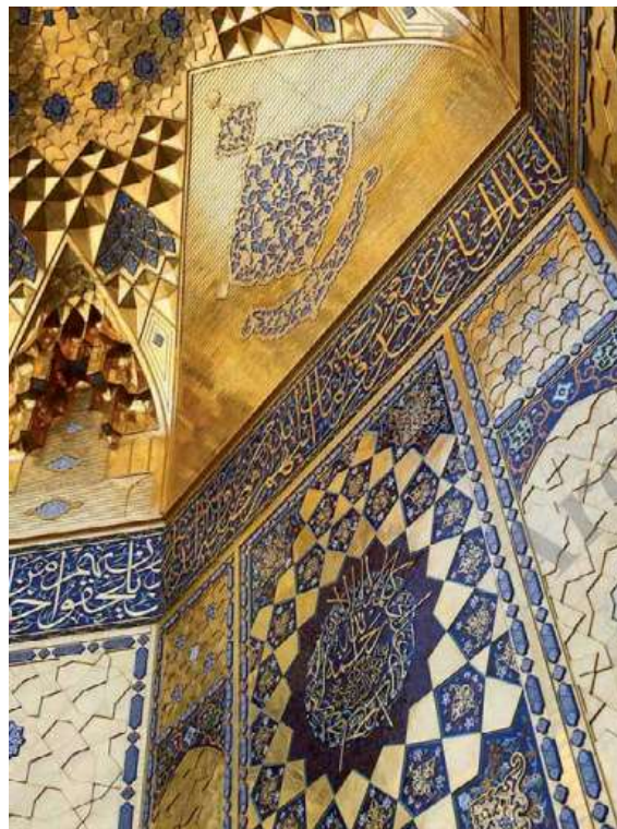
تصویر ۹- نمایی از ایوان صحن جمهوری (ایوان شرقی) مرقد مطهر امام رضا.

در خوشنویسی و کتیبه نگاری در معماری اسلامی، هنرمند از خود و اثر خود فاصله گرفته و به اصل ذات الهی پیوسته و در تلاش است اثر او برگرفته از مفاهیم الهی، و تجلی حق باشد. وفور کتیبه های قرآنی بر دیوارهای بناهای مذهبی یادآور این واقعیت است که؛ "کل حیات اسلامی با نقل قولهایی از قرآن در هم تنیده است و تلاوت قرآن و همچنین ادعیه، اوراد و اذکار مأخوذ از قرآن، پشتوانه معنوی این زندگیست." (رحمتی، ۱۳۹۰: ۲۲۳) همانند تجلی ذات الهی را میتوانیم در کتیبه های قرآنی در دیوارهای ایوان مرقد مطهر امام رضا (ع) نظاره گر باشیم. (تصویر ۹)