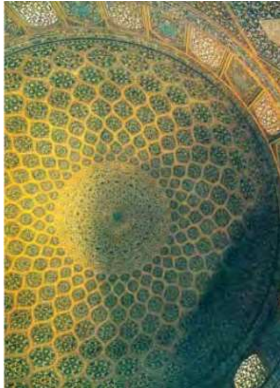
تصویر ۲- زیر گنبد مسجد شیخ لطف الله اصفهان، حلقه ی مرکزی و نمایش وحدت در کثرت.

"خلق و آفرینش، رکن عالم هنر است. هنرمند با "خلق" اثر هنری می کوشد نوعی ارزش زیبایی شناختی ایجاد کند. ... " (شهادی، ۱۳۹۳: ۳۰)