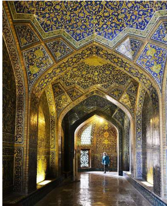
تصویر ۴- فضای داخلی از مسجد شیخ لطف الله اصفهان، راهروی ورودی.

یکی از مسائل اساسی هنر اسلامی، ارتباط با سرچشمه ی الهی است. هنر به مانند الگویی برای فهم آفرینش و خالقیت و فاعلیت خدا به کار رفته است. در فلسفه اسلامی هنر پاسخی ست در خور برای تبیین فعل خدا. در واقع خلاقیت انسان و فعل او، همانند خداوند، در عرصه ی هنر است که جلوه گری می نماید.