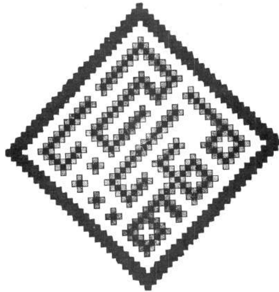
تصویر ۱- کتیبه معقلی زیر طاق ایوان بقعه زین الدین ابوبکر "یا حی یا قیوم"

آفرینش، رسیدن از عدم به وجود است. هنر نیز در ساحت الهی "بیان" است و بیان براساس اراده الهی، دلیل آفرینش است. بر طبق نگاه علامه طباطبایی، نظام هستی و آفرینش الهی، مبتنی بر اراده الهی و فاعلیت ذات الهی تشکیل می گردد که مطلق است. انسان خود نشانه ای مبتنی بر اراده الهی است و یا به عبارتی "بیان" است. از سویی هرچند که انسان محدود و نسبی است اما خالق نامحدود و مطلق. میتوان، آثار انسان ها را نیز بیان اراده و فاعلیت خداوند دانست. در نمونه هایی از آثار معماری شاهد مثالی این موضوع را در زیر گنبد شیخ لطف الله که گویای مضمون وحدت در عین کثرت است، نظاره گر هستیم. (تصویر ۲)