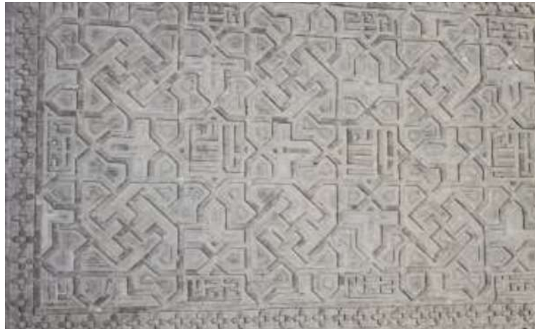
تصویر ۷- نوشتاری که در عین کثرت وارگی ساحتی واحد دارد. تزئینات روی ستون های ایوان مسجد جامع اصفهان.

جذابیت بصری خطوط خوشنویسی شده بر کتیبه های مساجد، در برابر دیدگاه بیننده و ذهن او نقش مفهومی فرازمینی و معانی نمادین برگرفته از ذات الهی را بیان می دارد. بنابراین "حروفی که در عین کثرت وارگی خویش، ساحتی واحد را تشکیل میدهند، امکان سیر معانی و مفاهیم معنوی را از صورت به معنا فراهم کرده و در ساختار صوری و باطنی خود، تداعی کننده رمز خلقت و حقیقت الهی می باشند." (احسنت؛ گودرزی سروش، ۱۳۹۶: ۱۲۱) استفاده از واژه هایی در کتیبه های بناهای اسلامی که نمایانگر وحدت در عین کثرت هستند. (تصویر ۷ و ۸)