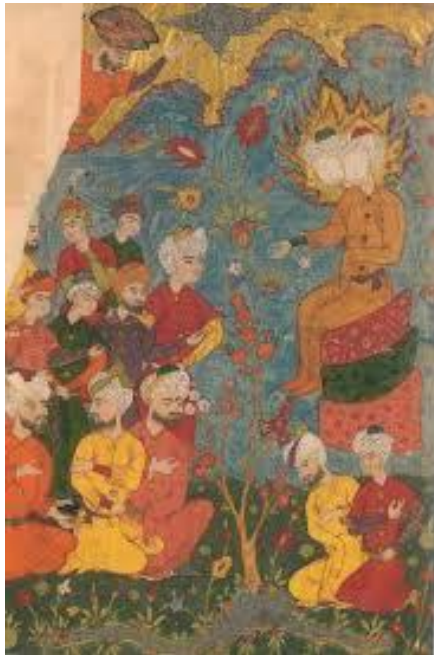
تصویر ۴: واقعه غدیر خم، فالنامه. دوره صفوی، موزه کاخ گلستان، تهران.