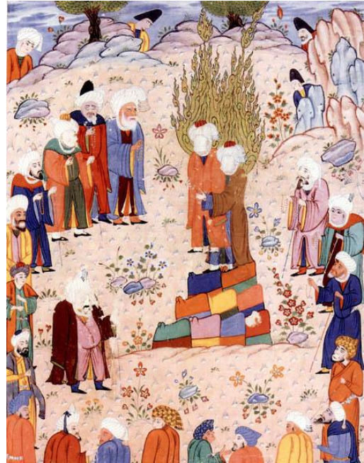
تصویر ۲: نگاره غدیر خم، نسخه احسن الکبار قرن ۱۶ میلادی، دوره صفوی، کاخ گلستان.

دوستانه در این نگاره بین افرادی موجود، می‌تواند گویای بیان آرام و بدون خشونت مسئله جانشینی علی (ع) باشد.