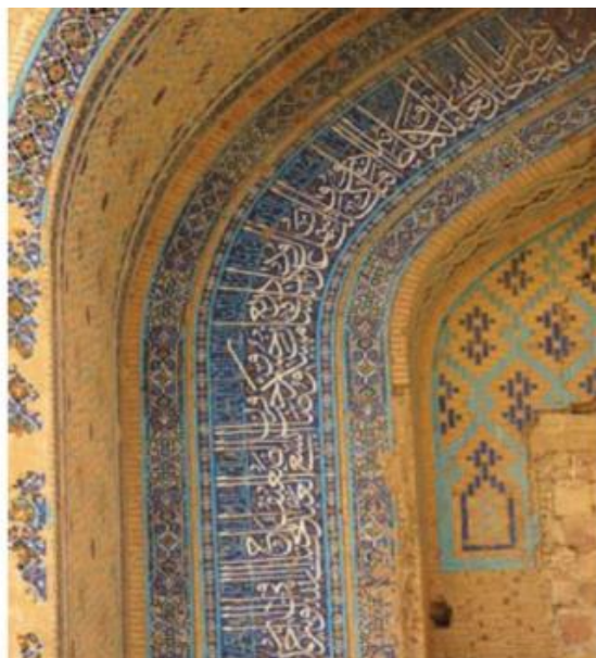
تصویر شماره ۲: کتیبه طوماری در مسجد خرگرد از بناهای دوره تیموری، ساخته شده در سال ۸۴۸ق. (منبع: نگارندگان)

این کتیبه که از نوع کتیبه‌های طوماری است به خط ثلث و کوفی است و دربردارنده مضامین مذهبی است. بررسی مفاد این کتیبه نشان می‌دهد، القاب شاهرخ که در سلطنت او این بنا ساخته شده است با کاشی معرق در این کتیبه تکرار شده است. واکاوی داده‌های آموزشی این کتیبه به نوعی تکرار روزمره صفات و القاب شاهی برای علم‌آموزانی است که در این مدرسه مشغول به تحصیل بوده‌اند در حقیقت می‌توان از آن به عنوان مشق وفاداری سیاسی برای علم‌آموزان یاد کرد.