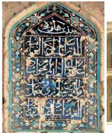
تصویر شماره ۱: کتیبه احداثیه مسجد خرگرد

آموزشی مفیدی است. کتیبه‌های تاریخی شناسنامه بنا هستند. متن این کتیبه‌ها در بردارنده اطلاعاتی درباره بانی، مباشر، معمار و تاریخ ساخت بنا است و از آنجا که اطلاعاتی درباره احداث بنا را می‌دهد به آن‌ها کتیبه‌های احداثیه نیز گفته می‌شود. در کتیبه‌های احداثیه متن را چنان تنظیم می‌کردند که نام حاکم وقت درست در وسط کتیبه قرار گیرد (طبسی و رئوف‌حجار زرین، ۱۳۹۲: ۳). کتیبه‌های احداثیه معمولاً در بردارنده اطلاعات تاریخی مفیدی هستند.