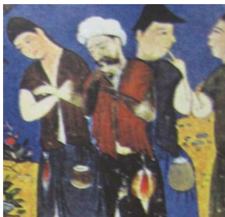
تصویر ۴: نگاره زندانیان در برابر خسرو (از گلچین اسکندرسلطان)، ۸۱۳ق.

نگاره «گلنار و اردشیر» از شاهنامه بایسنقری، نیز که تصویری از زندگی کاخ‌نشینی است که می‌توان در آن انعکاس تقاضا و درخواست را مشاهده کرد. این نگاره که خدمت‌گزاری و احترام به شاه را به تصویر کشیده است و نمایشی از رابطه خادم و مخدوم در دربار است.