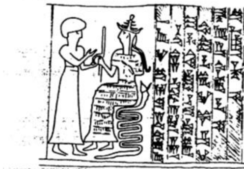
تصویر ۲. اثر مهر استوانه ای با صحنه اعطای عصای سلطنتی توسط خدا به حاکم، هفت تپه ۱۳۷۵ ق.م. (Negahban, 1991).

نشسته و از شانه‌هایش دو مار بیرون آمده است (Frankfoot, 1955, 56). نقش مار را به صورت مجزا یا به صورت موجودی ترکیبی با انسان در ارتباط با «اینشوشیناک» محبوب‌ترین خدای ایلامیان باستان می‌دانند، همان خدایی که «اوتناش گال» برای وی، زیگورات دوراوتناش را برپا کرد (صراف، ۱۳۹۱: ۱۳۶). نقش مار به عنوان یک نقش مایه خاص تمدن ایلام معرفی می‌شود و مهرهای استوانه‌ای متعددی در ارتباط با این نقش ترکیبی مار-انسان به دست آمده است (تصاویر ۲-۴). والتر هینتس در این رابطه می‌گوید: «مارهای منقوش به مثابه محافظ از درب‌ها بالا می‌روند، بر نقش‌های حک شده شاهان می‌خزند و دسته ابزارهایی چون تبر، عصا و چوگان سلطنتی را می‌سازند و تخت سلاطین و خدایان را تشکیل می‌دهند» (هینتس، ۱۳۷۱: ۴۷). در نقش برجسته «کورانگان» و بسیاری از نقوش مهرهای استوانه‌ای مار صرفاً اشاره بر حضور خدا در صحنه است (مجیدزاده، ۱۳۸۶، ۶۲). بنابراین مار یکی از نقش-مایه‌های اصیل تصویرسازی مهرهای استوانه‌ای ایلام را تشکیل می‌دهد. این مهرها از شوش و هفت تپه به وفور دست آمده‌اند و سمبل حاصل خیزی به خدای جهان زیرین، رب‌النوع چشمه آب و خدای بی‌مرگی است (نگهبان، ۱۳۷۲: ۴۳۵).