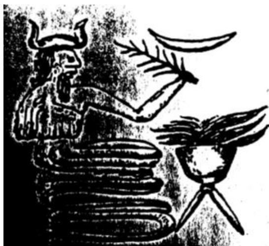
تصویر ۳. نقش مار- خدا در برابر آتش از شوش دوره ایلام قدیم، موزه لوور (Amiet, 1972).