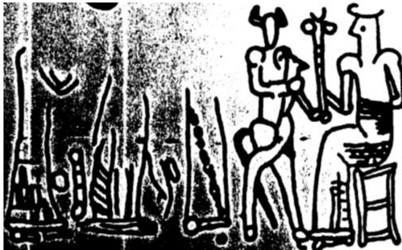
تصویر ۵. صحنه اساطیری آوردن هدیه توسط انسان- گاو برای یک خدا از هفت تپه. (Negahban, 1991)

اسفنکس یک هیولای افسانه‌ای است که منشأ آن به مصر باستان بر می‌گردد و سپس به صورت‌های مختلفی به آشور و یونان راه می‌یابد. گاهی سر آن به شکل قوچ، شاهین و یا قوش ترسیم شده است و بعدها به شکل زنی درآمد که تنه آن به شکل یک شیر بالدار بود (Ware; Stafford, 1974: 200). بنابراین به نظر می‌رسد اسفنکس ایلامی جنبه خارجی داشته باشد زیرا به یکباره بر روی مهرهای نیمه دوم هزاره دوم ق.م بر روی مهرهای استوانه‌ای شوش و چغازنبیل ظاهر می‌شود. این موجود در ایلام نیز جنبه مذهبی داشته است (Amiet, 1966: 49). حیواناتی نیز که در کنار اسفنکس‌ها بر روی مهرهای ایلامی نقر گردیده‌اند، بز کوهی و قوچ کوهی می‌باشد که احتمالاً اسفنکس رب‌النوع حیوانات و حافظ مالی آن‌ها تلقی می‌گردید (تصویر ۵).