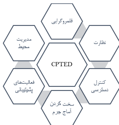
شکل ۱. اصول نظریه CPTED؛ مأخذ. (Cozens and Love, 2015: 396).

از وقوع جرم را کم کردن فرصت‌های مجرمانه می‌داند. این نظریه را می‌توان این‌گونه تعریف کرد طراحی مناسب و طراحی مناسب و کاربری مؤثر از محیط و ساختمان که منجر به کاهش جرم و ترس ناشی از جرم می‌شود به عبارت دیگر طراحی مناسب و استفاده درست از محیط می‌تواند علاوه بر پیشگیری از وقوع جرم، کیفیت زندگی را بهبود بخشد و ترس از جرم را کاهش دهد (Crowe, 2000: 46).