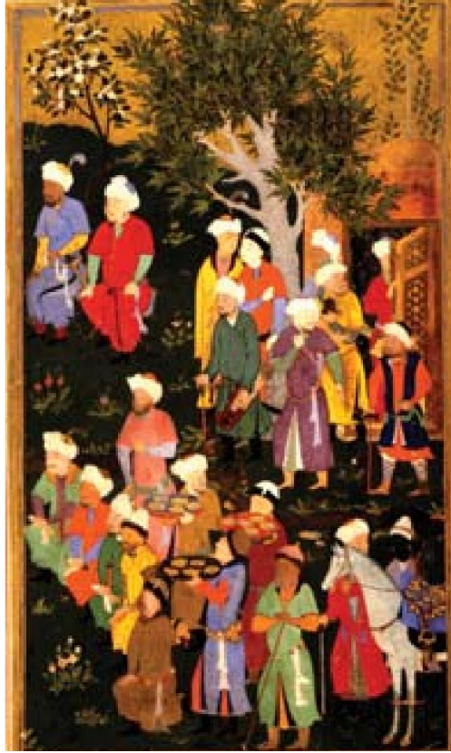
تصویر ۱: تصویری از تیمور لنگ در یکی از باغات سلطنتی. (مآخذ: ویلبر، ۱۳۸۷: ۷۷).

به هنگام تصدی امور فتوا و تکفل قضای هرات از وی خواسته شد تا کتابی به فارسی درباره آداب و رسوم آن امور بنویسد و وی مطالب این نسخه را از کتاب‌های فتاوی بیرون کشیده، و نوشته است. این کتاب درباره شیوه قضاوت و منابع مورد استفاده قضات در دوره تیموری واجد ارزش است. قاضی اختیار کتاب مهم دیگری به نام اخلاق همایونی دارد که برای بابر تألیف نموده است و نشانه خط مشی فکری و سیاسی وی می‌باشد (کریمی زنجانی اصل، ۱۳۹۴: ۵۹-۷۰). با توجه به اطلاعات منابع تاریخی و منشآت مشخص می‌گردد که شاه در رأس ساختار سیاسی نقشی محوری در نظام قضایی بر عهده دارد. در تصویر شماره ۲، نگاره‌ای است که دربار تیمور منعکس شده است. حضور علما در دربار وی می‌تواند بازتابی از اهمیت نظام قضا در این دوره باشد.