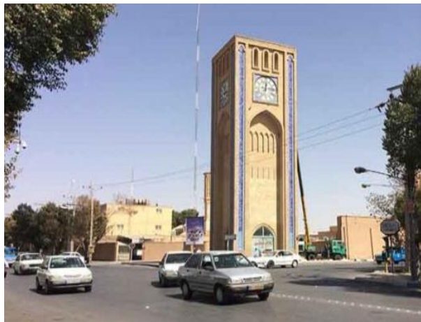
تصویر ۴- میدان ساعت در شهر یزد. مربوط به دوره قاجار.

مشخصه عمده معماری در دوره مورد بحث این است که معماری فرنگی به‌عنوان شاخص و طراز اصلی مورد توجه قرار گرفت؛ در این برهه، «هم‌ایده کلی از نوع فضا سازی و ساختمان‌سازی اروپایی مانند ساعت‌های بزرگ، ساختمان‌های مرتفع، بناهای عمومی، میادین و خیابان‌های خاص و سردرهای ورودی و هم عناصر کوچک و بزرگ کالبدی و تزیینی، شیروانی‌ها، ایوان‌ها، بالکن‌ها، پله‌ها و انواع تزیینات، به معماری سنتی ایران وارد گردید» (صفامنش، ۱۳۷۸: ۵۶). تصویر ۴ مربوط به یکی از میدانهای دوره قاجار است که به تعبیت از معماری غرب ساعت در آن تعبیه شده است.