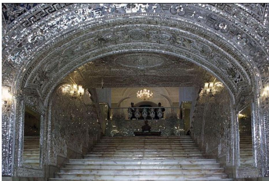
تصویر ۳- نمونه‌ای از آینه‌کاری در کاخ گلستان. تهران. عصر ناصری.

در این کاخ‌ها «تالارهای آینه و آینه‌های قدیمی که توسط گچ‌بری‌های پرکار و ظریف قاب شده‌اند، ستون‌ها و سرستون‌های مرمرین و تا حدی به سبک اروپایی، نقاشی‌های دیواری که تمام سطوح داخلی دیوارها را پوشاندند با موضوعات مختلف ثبت وقایع تاریخی مهم (جنگ‌ها و تاج‌گذاری‌ها)، چهره‌پردازی‌ها و تصاویر شخص شاه، نگارگری‌ها و مناظر، مجموعه‌های مرمرین و مفرغی در داخل و خارج ساختمان، ارسی و شیشه‌های رنگی، محوطه‌سازی انگلیسی و فرانسوی با سطوح وسیع چمن‌کاری و درختان تزئینی و بوته‌ای، حوضچه‌ها و حوض‌های مربع و مستطیل کوچک و بزرگ، در گوشه و کنار محوطه، گل‌کاری باغچه‌ها و خطوط کلی محوطه‌سازی و باغ‌سازی که تا حدی از حالت محوری خارج گردیده بود» (حبیبی، ۱۳۹۷: ۱۲۴).