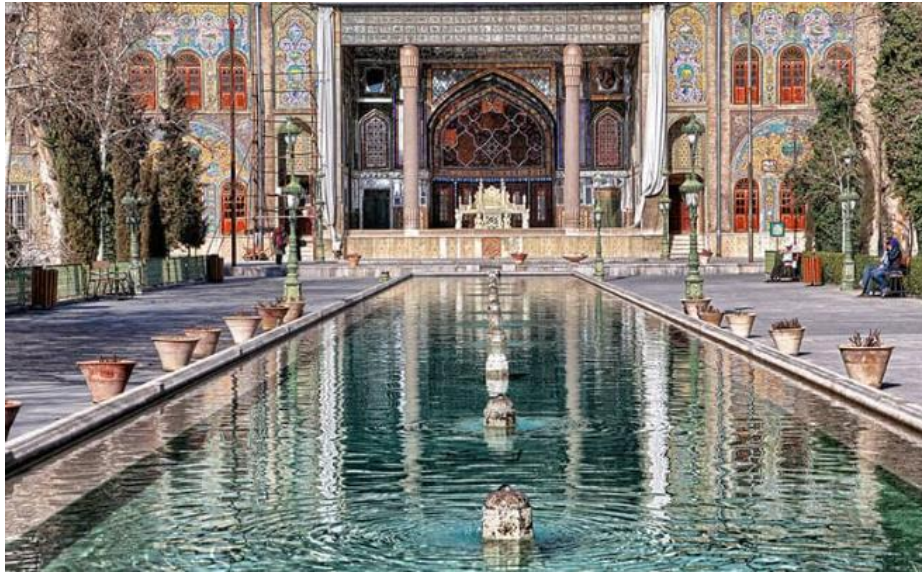
تصویر ۲- نمایی از حیاط کاخ گلستان، تهران. عصر ناصری.

در این کاخ‌ها «تالارهای آینه و آینه‌های قدیمی که توسط گچ‌بری‌های پرکار و ظریف قاب شده‌اند، ستون‌ها و سرستون‌های مرمرین و تا حدی به سبک اروپایی، نقاشی‌های دیواری که تمام سطوح داخلی دیوارها را پوشاندند با موضوعات مختلف ثبت وقایع تاریخی مهم (جنگ‌ها و تاج‌گذاری‌ها)، چهره‌پردازی‌ها و تصاویر شخص شاه، نگارگری‌ها و مناظر، مجموعه‌های مرمرین و مفرغی در داخل و خارج ساختمان، ارسی و شیشه‌های رنگی، محوطه‌سازی انگلیسی و فرانسوی با سطوح وسیع چمن‌کاری و درختان تزئینی و بوته‌ای، حوضچه‌ها و حوض‌های مربع و مستطیل کوچک و بزرگ، در گوشه و کنار محوطه، گل‌کاری باغچه‌ها و خطوط کلی محوطه‌سازی و باغ‌سازی که تا حدی از حالت محوری خارج گردیده بود» (حبیبی، ۱۳۹۷: ۱۲۴).