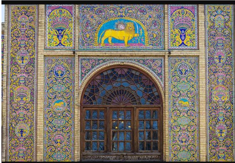
تصویر ۱- تزئینات دیوارهای کاخ شمس‌العماره، تهران. دوره ناصری. منبع: (نگارنده)

نماد این مؤلفه را باید در کاخ‌های عصر ناصری یافت و تحلیل نمود؛ عمارت شمس‌العماره، کاخ گلستان و قصر فیروزه از جمله نمادهای عینی تجمل‌گرایی ایرانیان است. تصویر شماره (۱) نمایی از شمس‌العماره را منعکس ساخته است.