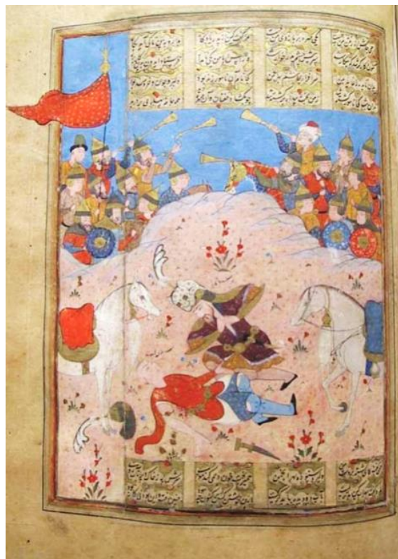
تصویر ۳- نگاره رزم رستم و سهراب، مکتب شیراز، ۹۹۷ه.ق.

در شاهنامه گاهی قدرت و اثرات آن، چنان مخرب و تأثیرگذار می‌شود که حاصل آن غم‌بارترین تراژدی‌های جهان می‌گردد. فردوسی به‌خوبی در دو تراژدی (رستم و اسفندیار) و (رستم و سهراب) نبردی که در راه کسب قدرت رخ داد را به تصویر می‌کشد و شخصیت‌های داستان‌ها را بر مبنای اثرات قدرت پایه‌ریزی می‌کند. تصویر شماره ۳، نبرد رستم و سهراب را به تصویر کشیده است.