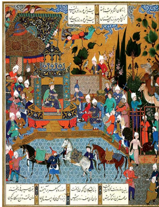
تصویر ۲: نگاره دربار فریدون، شاهنامه شاه‌طهماسب. موزه متروپولین.

تنوع شیوه بیان اثرات قدرت اسطوره‌ها در شاهنامه به‌ویژه نظام‌مند بودن آن‌ها گواه آن است که فردوسی خود به اهمیت قدرت و اثرات آن در پردازش کار داستان‌پردازی وقوفی کامل داشته است. ماجرای نبرد کیومرث، تهمورث، هوشنگ، جمشید و فریدون با پتیاره‌ها و اهریمن دوران خویش به ما این باور را می‌دهد که بدون شک اثرات مثبت فرهایزدی در همراهی این اساطیر در جای‌جای شاهنامه مشهود است. در تصویر شماره ۲ دربار فریدون به تصویر کشیده شده است.