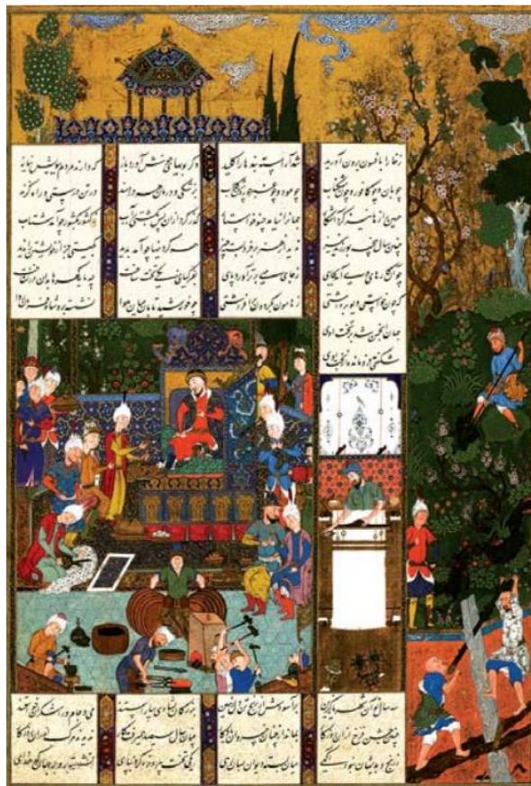
تصویر ۴- نگاره دربار جمشید. منسوب به سلطان احمد. شاهنامه شاه طهماسبی. دوره صفوی. مأخذ: (آزند: ۱۳۸۴).

در دوره‌های مابعد اساطیری شاهنامه، فر ایزدی جنبه تکوینی و طبیعی خود را به تدریج از دست داده، کارکردی و آزمودنی می‌شود. در دوره‌های پهلوانی و تاریخی، فر ایزدی بیشتر از طریق برکت کردار و رویکرد بخت و اقبال شناخته می‌شود.