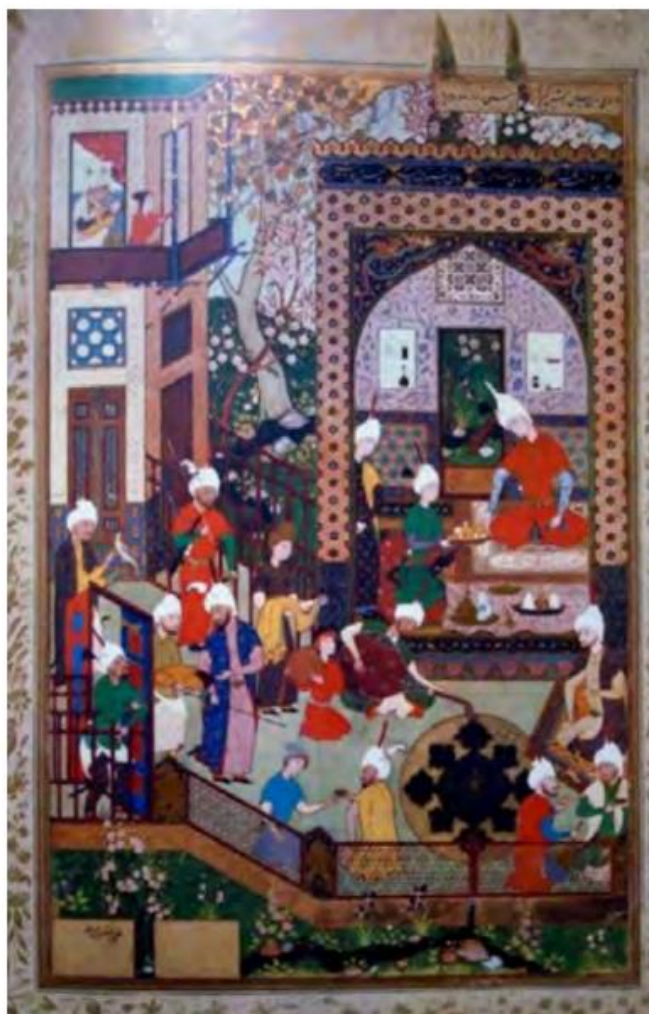
تصویر ۳-بارید در حضور خسرو، میرزا علی. خمسه شاه طهماسبی (۹۴۶-۹۵۰ ه.ق).