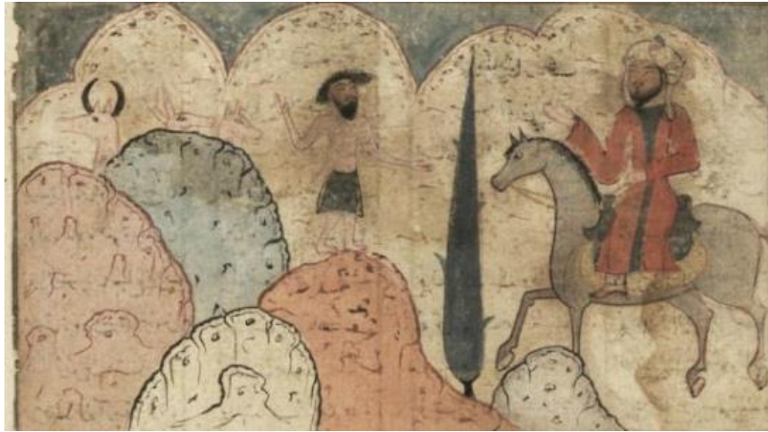
تصویر ۲: نگاره خبر دادن زید به مجنون از وفات شوهر لیلی، مکتب مغول. خمسه نظامی ۷۱۸ ه.ق. مأخذ: (ضرغام، داستان: ۱۳۹۵: ۵۷).