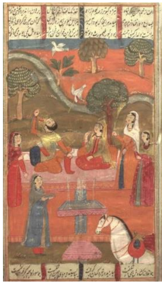
تصویر شماره ۴. نگاره جمشید شاه و سمن‌ناز (شاهنامه ۹۴۸ ه. ق، کتابخانه ملی)

مذاهب و آراء در آن وجود دارد، متین و قابل قبول است. بنابراین، با توجه به نظریات فقهایی که اشاره شد؛ حضور زنان در مجامع عمومی و علمی و شغلی که برای مردان حلال است، بدون هیچ تفاوتی برای بانوان نیز حلال و با حفظ حجاب و رعایت قوانین شرعی و اخلاقی مجاز و منع شرعی ندارد. در تصویر شماره (۴) نیز نقش پررنگ زن در مسائل نظامی و سیاسی در نگاره‌های مکتب تبریز صفوی ترسیم شده است. در دوره حکومت جمشیدشاه در زابلستان، شاهی به نام کورنگ داشت و او دختری زیبا آشنا به فنون جنگی داشت که نامش سمن‌ناز بود.