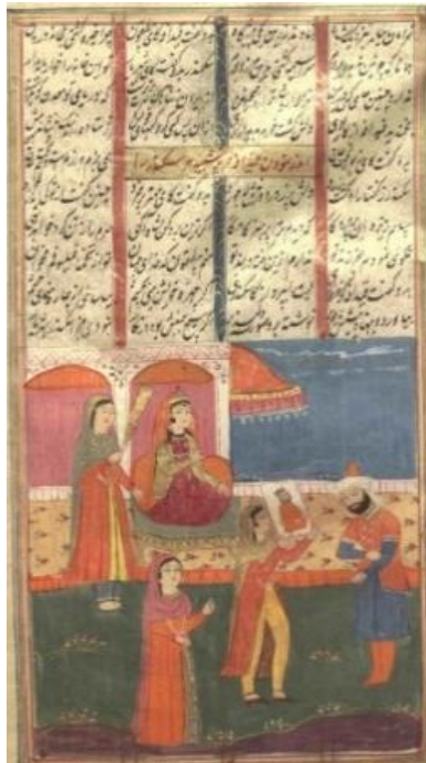
تصویر شماره ۱. نگاره اسکندر و قیدافه (شاهنامه ۹۴۸ ه. ق، کتابخانه ملی)