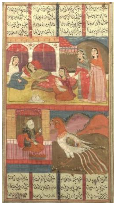
تصویر شماره ۳. نگاره به دنیا آمدن رستم (شاهنامه ۹۴۸ ه. ق، کتابخانه ملی).