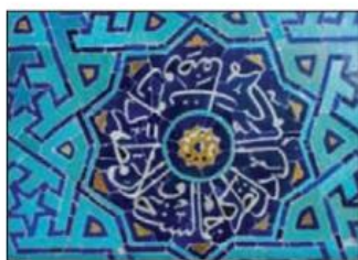
کاشی کاری مسجد جامع یزد.

آیا می‌توانید راه‌های دیگری برای کشیدن این ستاره هشت پر پیدا کنید؟