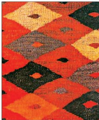
نمونی از گلیم تاهسون.

گلیم نقش‌دار بیافید: اغلب نقش‌های گلیم بر اساس طرح‌های منتهی و لوزی به‌وجود می‌آیند. متناسب با رنگ‌های نقش گلیم، مقداری کاموای رنگی تهیه کنید. یک قاب کهنه را به جای دار گلیم، چله‌بچی کنید و با راهنمایی معلم خود نقش گلیم زیر را بیافید.