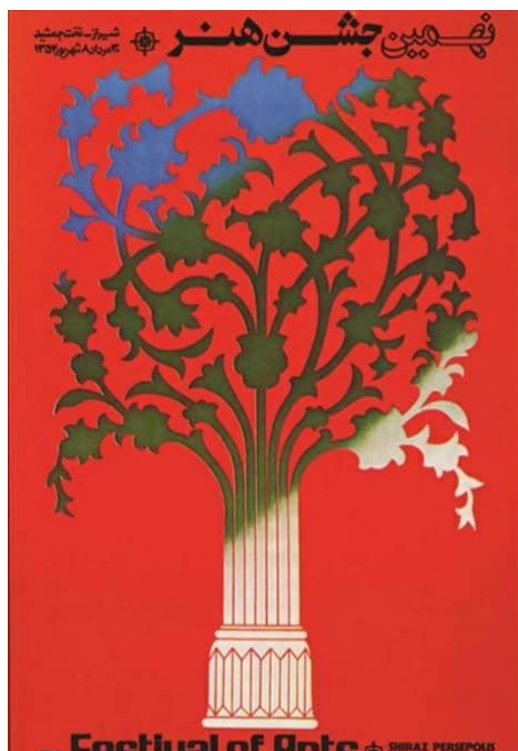
تصویر ۱: اثر گرافیکی جشن شیراز اثر مرتضی ممیز.

در اثر بالا، طراح کوشیده با کاربست نقش‌مایه درخت که به نوعی به حیات انسان اشاره دارد، این رویداد را به عنوان سمبلی از فراغت و ثبات اجتماعی مطرح کند. در دوره معاصر طرح‌های نیز کشیده شده است که درصد فقدان عدالت در برخی از جوامع و تلاش‌های انسان برای گذار از سختی‌های زندگی فردی و اجتماعی است. تصویر شماره (۲) با ترسیم کردن انسانی در برابر موانع یکی از طرح‌های گرافیکی معاصر در این زمینه است.