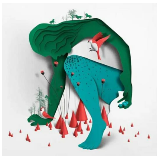
تصویر ۲: اثر گرافیکی زندگی. طراح نامشخص.

در اثر بالا، طراح کوشیده با کاربست نقش‌مایه درخت که به نوعی به حیات انسان اشاره دارد، این رویداد را به عنوان سمبلی از فراغت و ثبات اجتماعی مطرح کند. در دوره معاصر طرح‌های نیز کشیده شده است که درصد فقدان عدالت در برخی از جوامع و تلاش‌های انسان برای گذار از سختی‌های زندگی فردی و اجتماعی است. تصویر شماره (۲) با ترسیم کردن انسانی در برابر موانع یکی از طرح‌های گرافیکی معاصر در این زمینه است.