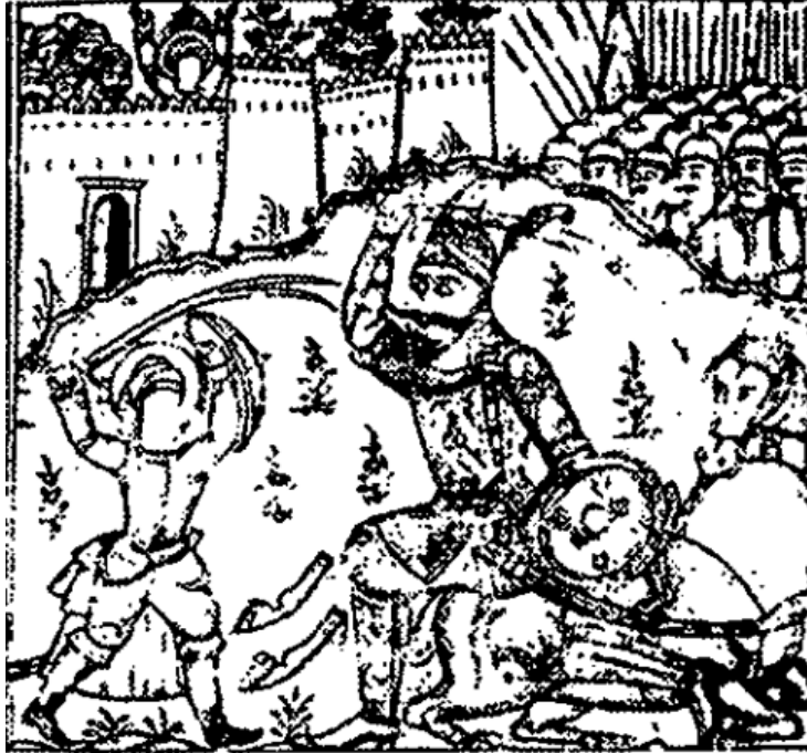
تصویر ۲: نبرد علی (ع)، نسخه حمله حیدری، ۱۲۶۴، مأخذ: (حسینی‌راد، خان‌سالار: ۱۳۸۴)

ترویج عقاید شیعیان در جامعه دوره قاجار و تقویت باورهای مذهبی شیعی سبب گردید تا آثار مذهبی بسیاری با چاپ سنگی عرضه شوند. این آثار نمایشگر بخشی از فرهنگ جامعه ایران در بزرگداشت ائمه و بزرگان مذهبی بودند که گاه رنگ اغراق و تمایل به خرافه نیز در این آثار مشهود است.