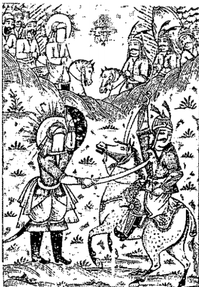
تصویر ۱: نبرد علی (ع)، نسخه افتخارنامه حیدری، ۱۳۱۰ ه.ق، دوره قاجار. مأخذ: (حسینی‌راد، خان‌سالار: ۱۳۸۴)

همان‌گونه که در گفتمان فرکلاف آمد، در یک جامعه، مجموعه‌ای از علل سیاسی، اقتصادی و فرهنگی باعث شکل‌گیری یک اعتقاد در جامعه می‌شوند. در جامعه عصر قاجار نیز تقارن تحولات سیاسی، اقتصادی و فرهنگی باعث ترویج اغراق یا خرافه‌پرستی شد که نقش کلیدی در عدم توسعه ایران داشت. این مسئله در نسخه‌های مذهبی نیز بازتاب یافته بود. نسخه چاپ سنگی حمله حیدری یکی از منابع مذهبی دوره قاجار است که به شکل نسخه سنگی چاپ شده است. اکثر تصویرسازی این نسخه اثر میرزا علیقلی خوئی از بهترین نقاشان چاپ سنگی دوره قاجار است. متن کتاب به شرح فتوحات حضرت علی (ع) پرداخته است. در این میان، تصاویر گاهی اغراق‌آلود است. تصویر ۱ به یکی از نبردهای علی (ع) اشاره دارد که در آن حضرت با یک ضربه شمشیر، حریف را از میان برمی‌دارد. (تصویر ۱)