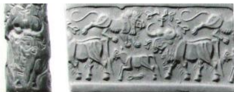
(Connan, 1996:212) تصویر ۶- مهر و اثر مهر استوانه‌ای هزاره سوم ق.م. خمیر قیر )

تصویر شماره ۵ گویای نقش پررنگ قیر در عناصر تزئینی در ایران در دوره باستان است؛ تزئیناتی که از مجسمه‌ها تا تزئینات بناها را در بر می‌گرفت.