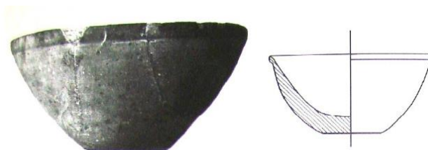
تصویر ۲- ظرف ساده لبه‌دار با بدنه محدب. جنس خمیر قیر (Connan, 1996: 151)

هم‌چنان‌که پیش از این گفته شد، در هزاره چهارم قبل از میلاد در دشت شوشان با ترکیب قیر طبیعی با شن و ماسه بادی، پودر سنگ آهک، مواد معدنی و گیاهی و حرارت کم به این مواد، ماده جدیدی به نام خمیر قیر بدست می‌آمد که از آن تا اواسط هزاره اول قبل از میلاد برای ساخت ظروف تزئینی و مصرفی، مهرهای مسطح و استوانه‌ای، سنگ وزنه، مهره‌ها و آویزها و ساخت ظروف استفاده می‌کردند (تصاویر ۹-۲).