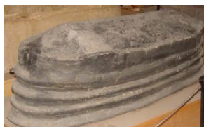
تصویر ۷- تابوت سفالی قیراندود. هفت تپه. ایلام میانی

در دوران ساسانی "خمره‌های کشف شده در بوشهر دارای خمیره‌ای با بافت ماسه‌ای و بدنه‌ای استوانه‌ای بودند که به کف مخروطی شکل ختم می‌شدند. لبه این خمره‌ها فتیله‌ای بود و با استفاده از قیر طبیعی بخش انتهایی آنها اندود شده است. این خمره‌ها که به نام خمره‌های اژدری شناخته می‌شوند، از محوطه‌های ساسانی در مرکز و جنوب بین‌النهرین و جنوب غرب ایران به دست آمده‌اند" (Adams, 1981:234؛ لباف‌خانیک و دیگران، ۱۳۹۲: ۷۷). تولید ظروف اژدری از دوره اشکانی آغاز و تا اوایل دوره عباسی ادامه داشته است. این ظروف که با استفاده از لایه‌ای از قیر طبیعی نشت‌ناپذیر می‌شدند، احتمالاً گونه‌ای محلی از نوع آمفوراها رومی برای انتقال شراب و مایعات بودند (Zemer, 1977). قیر در معماری در دوره تاریخی و بخصوص دوره ایلام، از قیر طبیعی به عنوان ملاط بین آجرها برای ساخت بناهای شهر شوش، هفت تپه و چغازنبیل استفاده شده است. معمولاً از قیر به عنوان ملاط در ساخت بناهایی مانند آرامگاه‌های مهم، آبگیر و بندها، حوض‌ها، مجاری و کانال‌های آب و آجر فرش حیاط‌های روباز استفاده می‌گردید. استفاده از این تکنیک علاوه بر دوره ایلام، در دوران هخامنشی نیز ادامه یافت و در ساخت بناهایی که میزان رطوبت در آنها بالا بود، از قیر به عنوان ملاط استفاده شده است. در مواردی نیز در دوره ایلام برای نصب آجرهای لعابدار، از گل میخ‌های آغشته به قیر استفاده شده است (زاهدی، ۱۳۷۸: ۱۷).