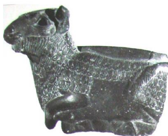
تصویر ۳- ظرف با دسته به شکل مجسمه،