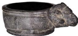
تصویر ۴- کاسه‌ای به شکل یک قوچ از خمیر قیر. (آرشیو: موزه ملی ایران).

تصویر شماره ۲ و ۳ و ۴، حاکی از کاربرد قیر در ساخت ابزار و ظروف زندگی روزمره است. این نکته خود تأییدی بر نقش پررنگ این ماده در حیات اجتماعی مردم در ایران دوره باستان دارد.