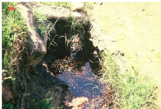
تصویر ۱- چشمه قیر طبیعی در منطقه دهلران

آشنایی ساکنان ایران با نفت طبیعی و مشتقات آن به دوران پارینه‌سنگی در غارکلدر باز می‌گردد (Tumung et al, 2015:179-196). ساکنان جنوب غرب ایران در دوران نوسنگی جزو اولین مردمانی بودند که با خصوصیات قیر طبیعی آشنا شده و به شیوه‌های گوناگون از آن استفاده کردند. آنها از خاصیت چسبندگی قیر طبیعی برای دسته‌گذاری ابزارهای متنوع نظیر داس‌های ترکیبی، کج بیل‌ها و درفش‌های استخوانی بهره می‌بردند. بر روی تیغه‌های سنگی و دسته‌های چوبی و استخوانی این‌گونه ابزارها آثار قیر طبیعی مشاهده می‌شود که نشان می‌دهد از این ماده طبیعی برای دسته‌گذاری ابزارها استفاده شده است (Connan, 1996:153). قدیمی‌ترین آثار استفاده از قیر طبیعی برای اتصال ابزار برنده‌سنگی به بدنه‌ی چوبی در ایران (غارکلدر) یافت شده است و متعلق به ۵۴,۰۰۰ سال قبل می‌باشد (Tumung et al, 2015:179-196). در این ادوار قیر به صورت طبیعی با استخراج از لایه‌های سطحی و زیرین زمین جمع‌آوری می‌شد. تصویر شماره یک انعکاسی از وجود آشکار نفت در منطقه جنوب غرب ایران است که تا عصر حاضر نیز در سطحی‌ترین لایحه زمین در این منطقه قابل مشاهده است (تصویر ۱).