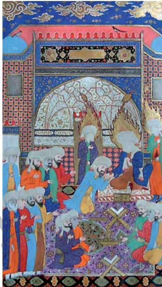
تصویر ۴: نگاره حضرت علی (ع) به همراه حسنین (ع)، حبیب السیر، دوره صفوی، موزه کاخ گلستان تهران.

مولانا از تعبیر «شیر حق» برای حضرت علی استفاده می‌کند و ضمن اشاره به ماجرای مبارزه‌ی آن حضرت با عمرو بن عبدود، پهلوان عرب، توصیه می‌کند که از علی (ع) اخلاص در عمل را بیاموزیم، زیرا او از فریبکاری پاک و منزّه بود و اگر کسی را هم در جنگ می‌کشت، برای رضای حق بود نه از روی هوای نفس و رفتارم گواهی بر دینم است: