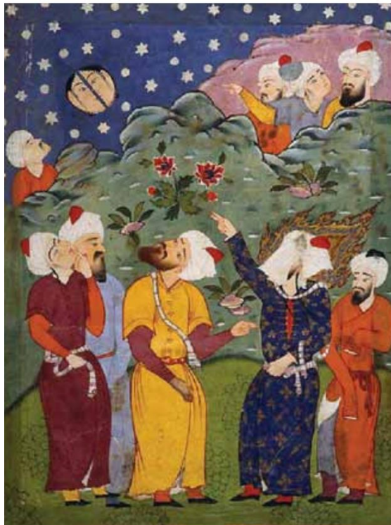
تصویر ۵: نگاره شکافتن ماه توسط حضرت محمد(ص). فالنامه. دوره صفوی. منبع: (افشاری: ۱۳۸۹)

گفت من تیغ از پی حق می زخم بنده حقم، نه مأمور تنم شیر حقم نیستم شیر هوا فعل من بر دین من باشد گوا (همان: ۳۷۸۸/۱-۳۷۸۷).