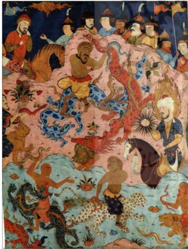
تصویر ۷: نبرد موسی با ساحران فرعون. فالنامه، دوره صفوی، منبع: (افشاری: ۱۳۹۷).

دیده بینا از لقای حق شود حق کجا همراز هر احمق شود (مولوی، ۱۳۷۶: ۲/۲۳۰۹-۲۳۰۷).