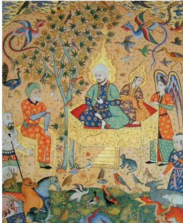
تصویر ۲: نگاره بلقیس و سلیمان، دوره صفوی. مجموعه ناصر خلیلی در لندن.

مولانا با اشاره به پادشاهی سلیمان (ع)، او را نمونه‌ی ولی یا انسان کامل می‌داند که بر همه‌ی وسوسه‌های نفسانی ملک و قدرت این دنیا غلبه یافته و ملک رها از تقیّدات و تعلقات را تصرف کرده و از آن بهره‌مند است (نیکلسون، ۱۳۷۴: ۳۷۲)؛ پس باید شخصی با همّت سلیمان باشد که بتواند از رنگ و بوی دنیا بگذرد: