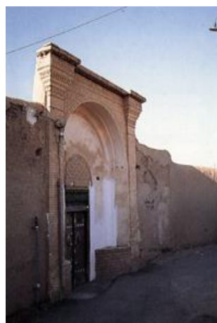
تصویر ۱: ورودی خانه جهان‌آرایی، کاشان.

هر مجموعه زیستی دارای ارزش‌های محیطی مختص به خود است. در مناطق مسکونی، مردم با ارزش‌های محیط مسکونی خود انس می‌گیرند. از این‌رو به‌نظر می‌رسد که خصلت‌های اجتماعی و فرهنگی، از خصلت‌های فضایی بافت و معماری شهر ناشی می‌شود. به بیانی دیگر، عناصر ساخته‌ی انسان یا به عبارتی محیط مصنوع، یکی از عناصر اصلی محیطی است که متقابلاً بر انسان و شکل فرهنگ او اثر می‌گذارد (نقی‌زاده، ۱۳۸۱: ۶۸). با پذیرفتن این فرض که معماری ظرف زندگی است و زندگی یعنی شیوه زیست و ارتباط انسان‌ها که از فرهنگ جامعه برمی‌خیزد، می‌توان اذعان کرد که معماری دارای هویتی است که بیانگر هویت فرهنگی پدیدآورنده آن است. لذا معماری در وهله‌ی اول، بیانگر ارزش‌های حاکم بر جامعه و در وهله‌ی دوم مبین ارزش‌هایی است که جامعه به آن تمایل دارد (بمانیان، ۱۳۸۹: ۵۷). از این‌رو اگر بپذیریم که کالبد، شکل، فضا و روابط در معماری بر رفتار انسان اثر می‌گذارد، می‌توان نتیجه گرفت که معماری به واسطه‌ی القای ارزش‌های جامعه، هویت‌ساز است. از سوی دیگر، معماری نوعی نماد محسوب می‌شود، زیرا به‌واسطه‌ی دارا بودن ماهیتی بصری و عملکردی، مهم‌ترین و پرمحتواترین نمادهای فرهنگ بشری را شکل می‌دهد. حال با توجه به نقش هویت‌ساز نمادها در هر فرهنگ، معماری نیز عنصری هویت‌ساز در فرهنگ هر جامعه محسوب می‌شود (ویسی، ۱۳۸۵: ۲۲۴).