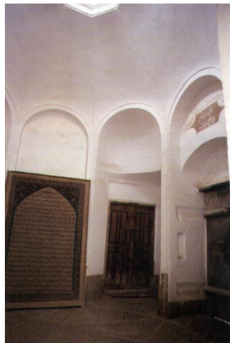
تصویر ۲: هشتی خانه رسولیان، یزد.

اگر چه کالبد معماری درون‌گرا، نخست به دلیل اقلیمی پدید آمده است، اما بعد و در ادامه‌ی حیات خود می‌تواند به تدریج زمینه‌ساز ایجاد فرهنگ، اخلاق و رفتار ناشی از درون‌گرایی باشد. در مقابل شخصیت درون‌گرا نیز علاقه به کالبد معماری درون‌گرا دارد (نقره‌کار، ۱۳۸۹: ۹۳). در واقع باید اذعان کنیم که هیچ ساخته و حتی فرآورده‌ی انسانی را نمی‌توان سراغ گرفت که از فرهنگ تأثیر نپذیرفته و یا بر آن اثر نگذارد (نقی‌زاده، ۱۳۸۱: ۶۳).