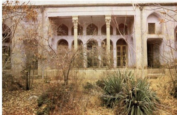
تصویر ۳: حیاط خانه دهدشتی، اصفهان.

طی بررسی اطلاعات حاصل از منابع متعدد کتابخانه‌ای و با استناد به نظرات پژوهش‌گران و محققان مختلف در خصوص ساختارهای هویتی معماری خانه‌های سنتی ایرانی، سرانجام فاکتورها و پارامترهای هویت‌ساز کالبدی، اجتماعی و فرهنگی خانه‌های سنتی ایرانی، شناسایی و در ۳ گروه دسته‌بندی گردید. در این طبقه‌بندی، برای هر یک از ۳ مؤلفه اصلی هویت‌ساز (کالبدی، فرهنگی، اجتماعی) زیرمجموعه‌هایی مرتبط با آن‌ها تعریف شده است که به ترتیب در (نمودار شماره ۳) ارائه شده‌اند.