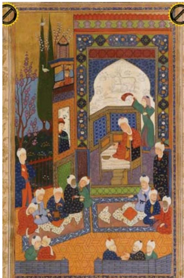
تصویر ۱. سرای پیر مغان. حافظ مصور. مکتب شیراز. محفوظ در موزه انستیتوی دهلی نو

در تصویر شماره ۱ از نگاره‌های حافظ مصور انستیتو دهلی نیز مضمون احترام به خوبی منعکس شده است.