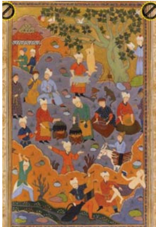
تصویر ۴. نخجیرگاه. حافظ مصور. مکتب شیراز. محفوظ در موزه انستیتوی دهلی نو

آه از آن نرگس جادو که چه بازی انگیخت آه ز آن مست که با مردم هشیار چه کرد؟ (۲ / ۱۴۱)