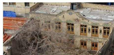
تصویر شماره شش - خانه امیری در شهر مشهد