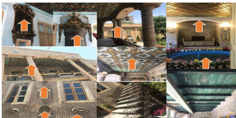
تصویر شماره ۹-خانه داروغه

البته مؤلفه‌های که می‌توان در این نمونه‌ها به آن‌ها اشاره کرد فراتر از مواردی هستند که به آن‌ها پرداخته شده‌اند که شامل اتاق مرکزی با اتاق‌های کوچک در اطراف آن تبدیل سه دری به دو دری و وارد شدن نور مستقیم به داخل بنا، محوطه‌سازی با سطوح وسیع، ایجاد زیرزمین با طرح‌های زیبا و پوشش ضریبی آجری - آئینه‌های قدیمی با گچ‌بری، حوضچه‌ها و حوض‌های مربع مستطیل، نقاشی دیواری با موضوعات مختلف، ایجاد چشم‌انداز وسیع توسط پنجره‌ها، تنوع، سبکی و گشایش فضاها، آذین‌بندی فضای داخل - پلان کشیده در امتداد بنا و... می‌باشند که با توجه به مطالعات و تطبیق‌های صورت گرفته اهم آن ذکر شد البته در زمینه تزئینات سایر مؤلفه‌ها کشف و شناسایی شد که در ادامه به بررسی آن‌ها در قالب جدول زیر می‌پردازیم. باید متذکر شد که تحولات و نوگرایی در هنر نقاشی قاجاریه ریشه در دوران صفویه دارد، اما در دوران قاجار نسیم تغییرات شروع به وزیدن می‌نماید. هنر نقاشی، مجسمه‌سازی و تزئینات قبل از هنر ساختمان‌سازی تحت نفوذ هنر غرب قرار گرفت. وجوه معماری که از دوران صفوی در معماری ما جریان داشته و هم اکنون نیز در بناهای دوره قاجار قابل مشاهده می‌باشد شامل؛ کاشی هفت رنگ و معرق، آجرکاری، گچ‌بری و آرایه‌های چوبی می‌باشد که در خانه‌های مورد مطالعه بررسی شده است. (جدول شماره سه)