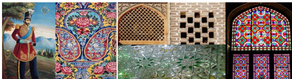
تصویر شماره دو- تزئینات بکار رفته شده در معماری دوران قاجار

هفت رنگ و لعاب‌های رنگارنگ، نمای داخلی گچ‌بری و کاشی‌کاری، استفاده از آرایه‌های چوبی در تزئینات، شیشه‌های رنگی، نقاشی‌های لندن کاری، استفاده از آجر تزئینی قالبی و تراش مخصوص دوره قاجار، استفاده از تزئینات آینه‌کاری، استفاده از کاشی منقوش و نقش دار (نقوش اساطیری کهن و درباری)، استفاده از قواره آجر تراش در تزئینات مکان‌های مذهبی، رسمی‌بندی و کاربرندی از جمله تزئینات قاجاری هستند (نظربلند، ۱۳۹۶: ۸). (تصویر شماره دو)