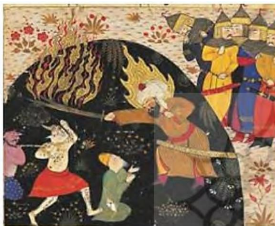
تصویر ۲: نگاره علی (ع) در جنگ با اهریمن. کتاب خاوران‌نامه ابن حسام خوسفی (۸۸۱-۸۸۳ق).

مطالعه و بررسی رویکرد مکتب اجتهادی به مقوله‌های هنر و زیبایی نشان می‌دهد این مکتب به موازات رویکرد فرهنگ اسلامی دارای نظر مثبت بوده است. در قرآن کریم که نخستین منبع فقه اجتهادی است، هنر و زیبایی مورد توجه هستند. علمای بزرگ اسلامی هر یک به اقتضای شرایط زمان به اظهار نظر در این باره پرداخته‌اند. در مواردی از آیات قرآن در تعریف زینت و زیبایی سخن به میان آمده است و زیبایی منظره آسمان را به وسیله ستارگان، به مردم گوشزد می‌نماید و به خود نسبت می‌دهد. خداوند زیبایی را نشانه‌ای از نشانه‌های خود معرفی می‌کند. با این حال بحث رعایت حدود اسلامی در به کارگیری هنر مطرح است. هنرمند باید از هنر به عنوان وسیله‌ای در بهسازی جامعه استفاده کند. بنابراین هنر نمی‌تواند به خودی خود هدف باشد. علاوه بر قانون تحول اجتهاد می‌تواند به برخی اخبار و روایات بحلال و مباح بودن این هنر تمسک جست (جناتی، ۱۳۷۵: ۱). با این حال در رویکرد اجتهادی نگاه عقل‌گرایانه زمینه را برای پویایی بیشتر هنر و زیبایی در عصر حاضر فراهم می‌سازد. نگارگری قدسی نیز یکی از ابعاد زیبایی‌شناسی در هنر اسلامی است. خاوران‌نامه اثر ابن حسام خوسفی (۸۸۱-۸۸۳ق)، یکی از آثاری است که در آن نگاره قدسی وجود دارد.