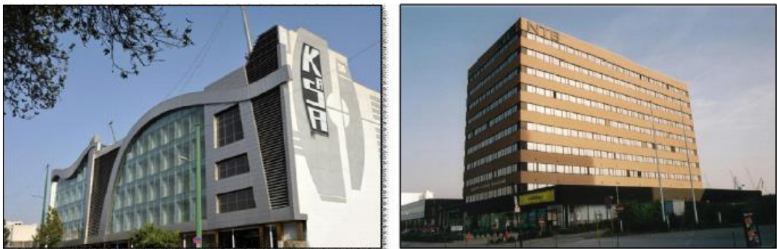
تصویر ۲: سیمای دو مرکز تجاری در ایران و اروپا.

تصویر ۱. بروز بحران هویت در معماری و شهرسازی معاصر ایران به دلیل عدم تجانس و تناسب میانی بینشی و ارزشی این نظام با کنش-ها و سبک‌های کالبدی آن (ریبسی، ۱۳۹۵: ۷۱)