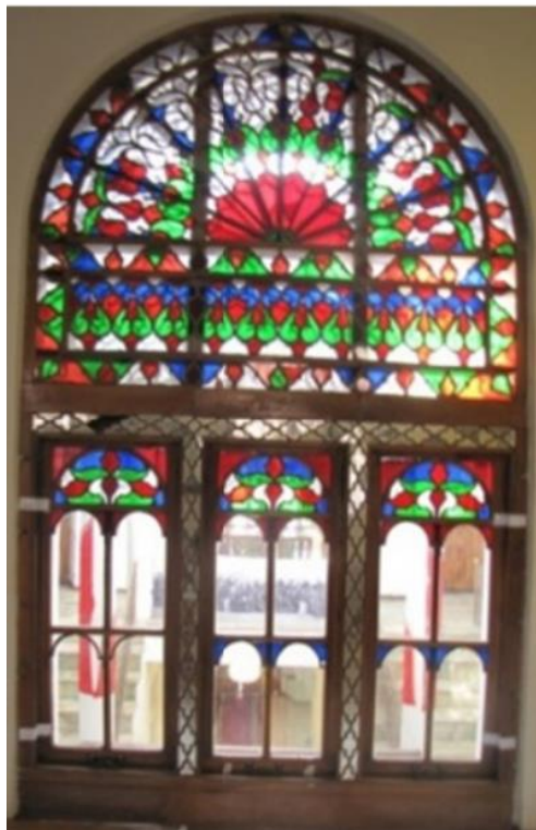
تصویر ۳: نمونه‌ای از ارسی‌های خانه مشروطه تبریز.