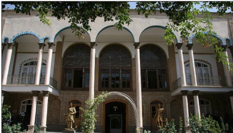
تصویر ۲: نمایی از مجسمه‌های حیاط خانه مشروطه تبریز.