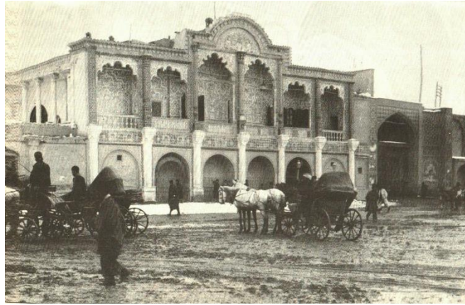
تصویر شماره ۳. بانک شاهی و دروازه خیابان چراغ گاز

شیوه زندگی است (خواه به دلیل بالا رفتن سطح بهداشت یا ترجیحات اقتصادی و فرهنگی برای مهاجرت) که در ترکیب جمعیتی شهرها تغییر ایجاد می‌کند.