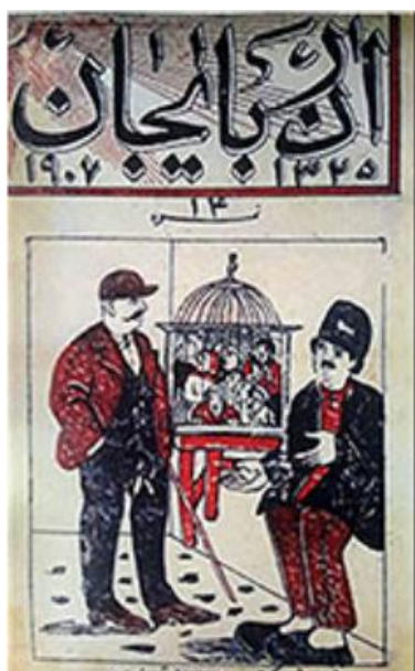
تصویر ۲. روزنامه آذربایجان، ۱۳۲۵. محل نگهداری: کتابخانه ملی ایران

لوگوهای مطبوعاتی که در روزگار قاجار «سرعنوان» نامیده می‌شدند، حاصل تلاش‌های آغازین طراحان گرافیک (به تعریف امروزی) برای خلق لوگوهای نوین هستند. این آثار قسمتی از دودمان گرافیک امروزی ایران را تشکیل می‌دهند که توجه به آنان به سبب نحوه بیان بصری و از سوی دیگر، شناخت شرایط ویژه دوران قاجار حائز اهمیت است. به‌عنوان دامنه مطالعاتی، این مقاله از شعر دوران مشروطه که رابطه مستقیمی با گفتمان مشروطه‌خواهی در دوره قاجار دارد و در آن چهره‌هایی چون بهار، عارف، سید اشرف، میرزاده عشقی و فرخی، پُررنگ هستند، سود می‌برد.