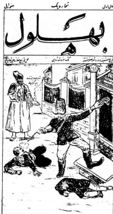
تصویر ۳. روزنامه قاجاری بهلول. شماره ۱۳۲۹/۱۶. محل نگهداری: کتابخانه ملی ایران

در تصویر فوق ترسیم مضامین مربوط به مبارزه و اغراق در این اثر قابل مشهود است. به نظر می‌رسد که طراحان گرافیک در بخش نوشتار لوگوها، علاوه بر استفاده از خوش‌نویسی با استفاده از ترفندهایی چون تغییر چینش حروف، ساده‌سازی، برجسته‌سازی و اغراق، به بیان بصری جدیدی نائل شده‌اند؛ از طرف دیگر با وجود این‌که تصویر بر مبنای نوشتار طراحی شده اما گاه از نظر میزان اشغال فضا و انتقال مفاهیم به آن برتری می‌یابد. در لوگوهای مصور مطبوعاتی، نشانه‌های فرهنگی دیرپا و ریشه‌دار با بیانی نو و متناسب با دوران و به‌مثابه بخشی از گفتمان حاکم، بازتولید شده‌اند (لاری، ۱۳۹۶: ۷۱). در تصویر شماره ۳ نیز مضمون ظلم و استبداد و مبارزه به تصویر کشیده شده است.