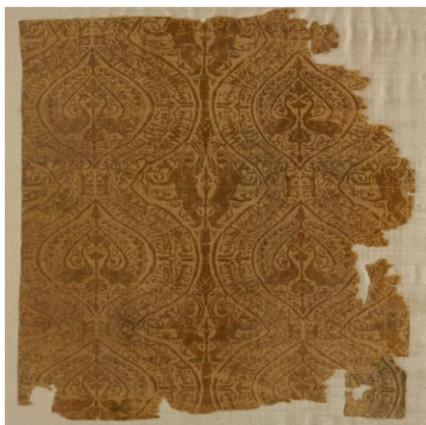
تصویر ۴: پارچه با نقوش حیوانی و هندسی، دوره عباسیان، (۷۵۰-۱۲۵۸م) در موزه کلیولند.

واژه «طراز» معرب و به معنی نگار جامه است، سیوطی در کتاب/المزهر گفته: فمّا اخذوه العرب من الفارسیة. (سیوطی، ۱۳۶۹: ۲/ ۱۹۷) اصطلاحاً «طراز» به نوعی پارچه با حاشیه ای از نوع علامت یا نوشته اطلاق می شد که به صورت بافته یا گلدوزی شده بود. این حاشیه روی لباس مأموران دولتی نقش می بست و به شیوه معمول تاروپودی از رشته ای طلا و نخ های رنگی دیگر داشت (چیت ساز، ۱۳۷۹: ۳۲). تصویر شماره (۴) نمونه ای از طرازهای دوره عباسی را نشان می دهد.