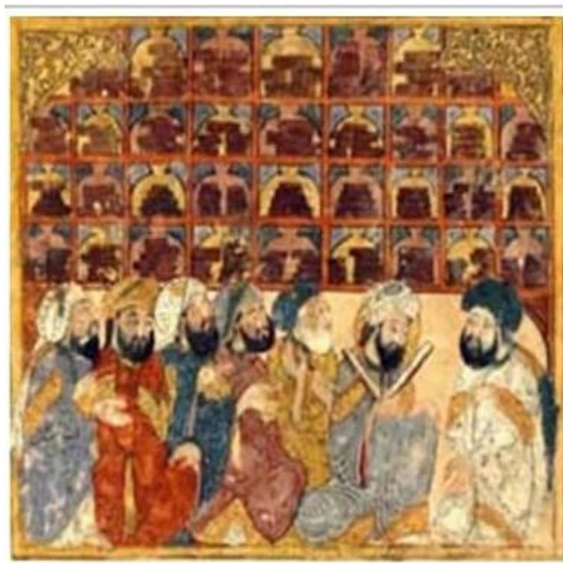
تصویر ۳: نگاره الحلوایه، کتاب مقامات حریری، اثر یحیی الواسطی، مأخذ: (ماه وان، ۱۳۹۲)

مرکز اصلی مکتب نقاشی عباسی، شهر بغداد بوده است. مکتب بغداد نامی است برای آشناسازی نقاشی‌های متعدد کتاب‌های خطی در حکومت عباسیان به خصوص آثار خلق شده در پایتخت آنها، بغداد. مکتب عباسی سنت‌های تصویری کلاسیکی، بیزانسی و مانوی و نیز نوعی واقع‌گرایی را تلفیق کرده است که می‌توان در آثار این عصر مشاهده کرد (الگ گرابر، ۱۳۷۹: ۱۷۸). در عصر عباسی همزمان با تألیف و ترجمه کتاب‌های علمی درباره پزشکی، نجوم، مکانیک و فیزیک توضیح تصویری در این نوع کتب ضرورت پیدا کرد حتی برخی نقاشی‌ها از نسخه اصلی یونانی گرفته شد. در این زمان نقاشی و مصورسازی کتاب‌های داستان و تاریخی نیز رونق یافته است. طی قرن‌های ۶-۷ این کتاب‌ها به دست هنرمندان مسلمان ایرانی، مسیحی و عرب رسید؛ از این رو نقاشی‌های غیر متجانس در آنها چیز عجیبی نیست.