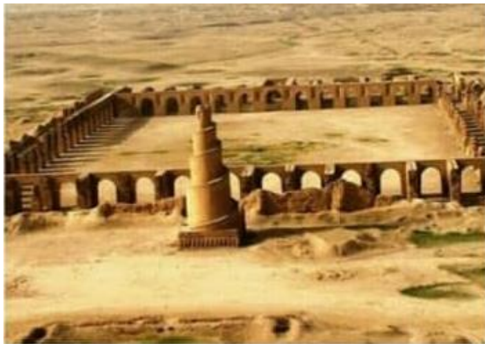
تصویر ۲: مسجد جامع سامرا، دوره عباسیان

تزئین قسمت‌هایی از مساجد به خصوص گنبد و مناره‌ها هنرنمایی داشته‌اند. درحالی که دیوارها و زمین آن به دلیل حکم دین اسلام مبنی بر پرهیز از تصویرگری و تجسم، از هرگونه نقش و نگار خالی بود (خطیب بغدادی، ۱۴۱۷: ۷۶/۱). در تصویر شماره (۲) نمایی از مسجد جامع سامرا منعکس شده که در دوره خلافت متوکل عباسی بنا شده است.