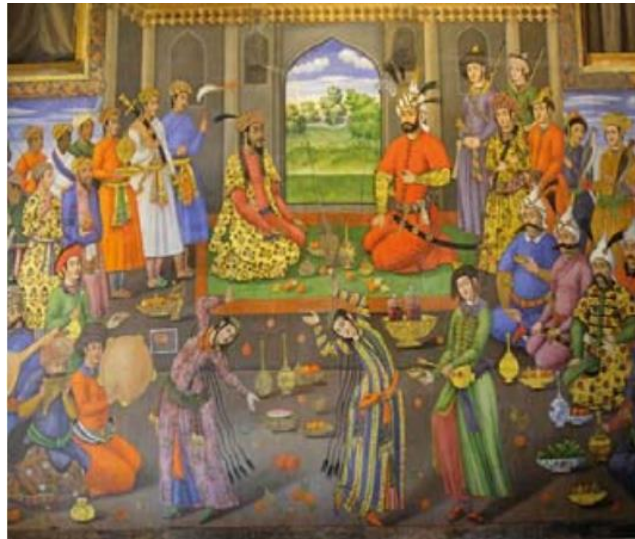
تصویر ۲: نگاره پذیرایی از همایون شاه در کاخ چهلستون، دوره صفوی.

حضور نوازندگان زن در این دوره حاکی از فعالیت زنان هنرمند در جامعه است. در تاریخ ایران پس از اسلام دوره صفوی هم به لحاظ دگرگونی‌های مهم سیاسی و فرهنگی نقطه عطفی محسوب می‌شود و در نگارگری صفوی نیز می‌توان حضور زنان هنرمند را مشاهده کرد. در دوره تیموری و صفوی هنرمندان زن در مراسم‌های درباری حضور داشته‌اند.