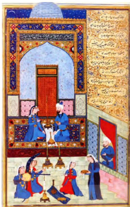
تصویر ۶: نگاره گنبد آبی، خمسه نظامی، مکتب هرات، ۹۶۰ ه.ق.

رنگ آبی «الهام‌بخش عواطف روحانی، معنوی، عرفانی و عامل وحدت» است (فلسفی، ۱۳۹۰: ۳۰). «آبی سمبل الهام و ایثار، صلح و آرامش است. رنگی بسیار مطلوب برای تعمق و مراقبه و مکان‌های شفا» (ویلز، ۱۳۹۲: ۱۳۶). عطار در مثنوی‌های خود ۶۲ بار واژه‌های جایگزین و مصادیق دیگر رنگ آبی را به کار برده است جز یک مورد، از خود رنگ‌واژه آبی استفاده نکرده است و به جای آن، واژه‌های کبود، نیلی، ازرق، کحلی و... را به کار برده است. او جنبه‌های منفی رنگ آبی را بیشتر با رنگ‌های کبود، ازرق و نیلی، و جنبه‌های مثبت و شاد آن را با رنگ فیروزه‌ای نشان داده است. در نگاره‌های هفت‌گنبد نظامی از رنگ آبی برای تصویرکردن شادی، زندگی و امید استفاده شده است. تصویر شماره (۶) این نگاره را منعکس ساخته است.