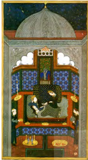
تصویر ۱- گنبد سیاه، هفت‌گنبد نظامی، مکتب هرات، ۸۴۹ ه.ق.

۱۹. سیاه، نماد و رنگِ نفسِ اماره و تعلّقات آن