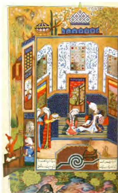
تصویر ۲- گنبد سفید، خمسه نظامی، مکتب هرات، ۸۹۸ ه.ق.

رنگ سفید باعث آرامش روحی و روانی می‌شود و اغلب، معانی و مفاهیم مثبت به همراه خود دارد. سفید، نشان نور، زیبایی، پاکی، پاک‌دامنی، عفت، صداقت، نشاط، امید و صلح است. «جنبه مثبت سفید، نمایانگر رو شنایی، پاکی، معصومیت و بی‌زمانی است و جنبه منفی‌اش، نمایانگر مرگ، وحشت و نفوذناپذیری گیتی» (اسماعیل‌پور، ۱۳۷۷: ۲۲). رنگ سفید و واژه‌های جانشین آن، در مثنوی‌های عطار ۴۴۰ بار به کار رفته است. این رنگ در اکثر موارد در بافت معنایی عاشقانه و غنایی، برای بیان زیبایی ظاهری، در راستای تبیین آموزه‌های عرفانی مورد استفاده قرار گرفته است. عطار در کاربرد این رنگ بیشتر به جنبه‌های مثبت آن نظر داشته و بعضی از مفاهیم انتزاعی را به این رنگ می‌دیده است. نظامی نیز در هفت‌گنبد از رنگ سفید برای بیان پاکی و عرفان بهره جسته است.