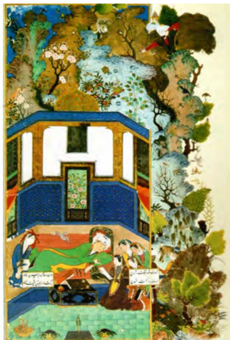
تصویر ۴: گنبد سبز، خمسه نظامی، مکتب هرات، ۹۲۸ ه.ق.