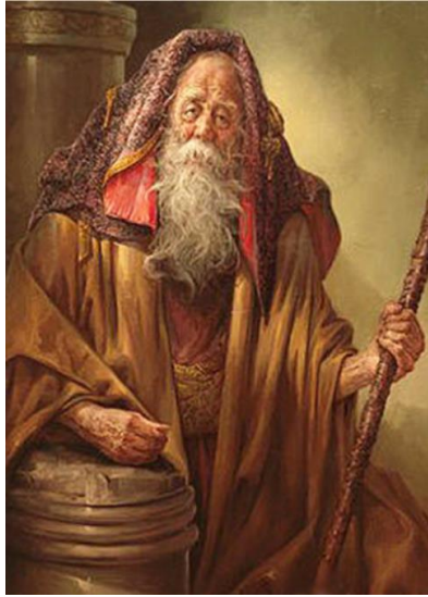
تصویر ۴- چهره پردازی پیرمرد. اثر عباس کاتوزیان، دوره معاصر.

توصیف صحنه دعوی پدر و مادر یونس در داستان کوتاه قرنطینه (مجموعه تنهاتر از ماه): هنگامی که پا به درون حیاط گذاشت که طبل دعوا از صدا افتاده بود و مادرش با لب شکافته و خون چکان، دندان شکسته‌اش را کف دست گرفته و آن را تماشا می‌کرد. انبوهی از موهای مشکی سرش هم به شاخ و برگ بوته نیلوفر کبود پیچیده بود. ناخن مادر گونه‌های پدرش را چنگ زده و به خون انداخته بود. انگار گربه به آن چهره‌ی زردرنگ و پلاسیده ناخن کشیده بود. پیراهن مندرس پدر تا پایین جرخورده و در جستجوی دگمه‌های کنده‌شده کف حیاط را می‌کاوید. خواهرانش با چشمان وحشت‌زده، موهای آشفته، لباس‌های کهنه و پاره، چهره‌های زردرنگ در گوشه‌ای می‌لرزیدند و صداهای نامفهومی که به خرخر جانوری سربریده شبیه بود از گلو بیرون می‌دادند. / سفره‌ی خالی نان در وسط حیاط پرتاب‌شده و کوزه شکسته آب در کنارش متلاشی شده بود (یاقوتی، ۱۳۹۰: ۶۳). پرداختن به زندگی روستاییان علاوه بر ادبیات ناتورالیستی در نقاشی نیز دیده می‌شود. اثر زیر که یک مرد روستایی را ترسیم کرده است از آثار ناتورالیستی عباس کاتوزیان است.