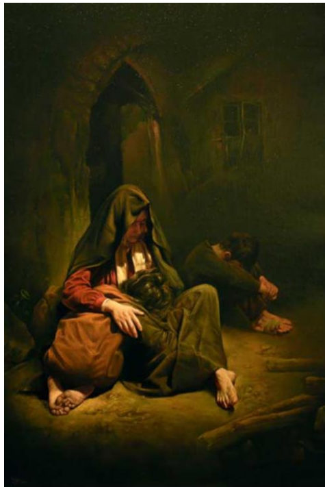
تصویر ۲: نقاشی مادر و فرزندان، از عباس کاتوزیان، دوره معاصر.

سیرنگ بی‌اعتنا به تهدیدها و دشنام‌های او، چاقوی تیز را از جیب بیرون آورد، تیغ‌اش را گشود و چند لحظه بعد فریاد جگرخراشی از مختار برخاست و سیرنگ بیضه‌های او را گوشه‌ایی پرت کرد (یاقوتی، ۱۳۸۹: ۱۲۰). تصویر شماره (۲) نیز به‌عنوان یکی از نقاشی‌های ناتورالیستی عباس کاتوزیان، وضعیت طبقات فرودست جامعه را به تصویر کشیده است.