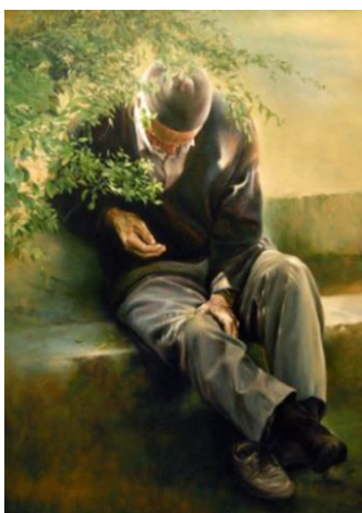
تصویر ۱- پیرمرد خوابیده در طبیعت، اثر عباس کاتوزیان، دوره معاصر.

و در داستان رامونا (مجموعه توشای پرنده غریب زاگرس): «آگه مرد بودم از دیوار بالا می‌کشیدم و تو کوچه می‌پریدم و می‌رفتم به شهر. برای یه مرد همه‌جا برای خوابیدن جایی هس، یه مرد میتونه هر جا که دلش می‌خواود بره، مرد آزاده، مته زن اسیر نیس، ما اسیریم سیندخت، ما برده به دنیا آمدیم و برده می‌میریم. آگه زن نبودم یه دقه هم تو این گورستان نمی‌ماندم» (یاقوتی، ۱۳۷۴: ۲۳). تصویر شماره (۱) نیز یکی از نقاشی‌های عباس کاتوزیان است که می‌توان واقع‌گرایی مربوط به زندگی روزمره، پیوند طبیعت و انسان را مشاهده کرد.