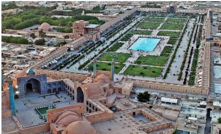
تصویر ۳. میدان نقش جهان اصفهان در روزهای بدون تردد وسایل نقلیه (URL ۱).

نداشتند از جمله: تابلوهای راهنمایی رانندگی، ایستگاه اتوبوس و دیگر تجهیزات مدرن و اضافی از فضای میدان حذف شوند (تصویر ۳). در حال حاضر هیچ توجهی به مکان‌یابی و استفاده از عناصر به‌درستی انجام نگرفته و وسایل و تجهیزات عمومی و شهری همچون: سطل‌های زباله، نیمکت‌ها، نورپردازی‌ها، کیوسک پلیس گردشگری و... موجب شده‌اند که فضای دید و بصری در این محیط باز نسبت به گذشته مخدوش شده باشد و آن جنبه‌ها و کاربردهای تاریخی و فرهنگی خود را از دست بدهد.